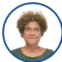
Mar Mas Presidenta

La AMDP continúa con su labor de crear red entre las mujeres que forman el deporte. Gestoras, psicólogas, abogadas, técnicas, árbitras, deportistas... Entre todas, seguimos empujando para crear una sociedad que tenga erradicada la desigualdad de las mujeres en el deporte. Hasta entonces, deberemos continuar. Esto #NoSeAcabó.