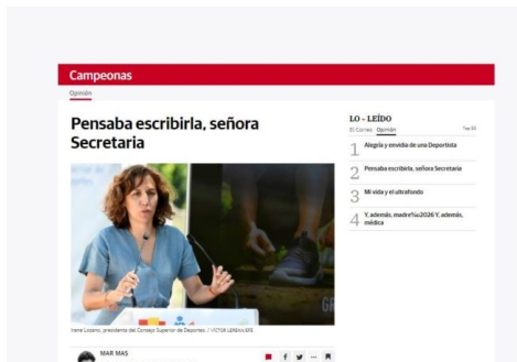
El correo. Pensaba escribirla, señora Secretaria. Mas Mas.