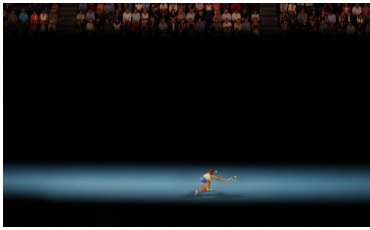
SAVE THE DATE

Libro Blanco para un trato justo y equitativo de las mujeres en el deporte profesional.