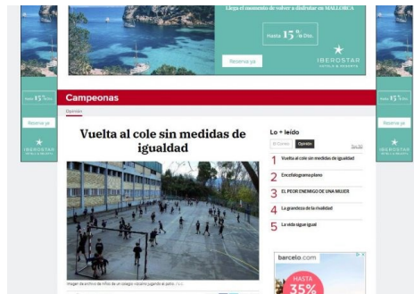
El correo. Vuelta al cole sin medidas de igualdad. Mar Mas.