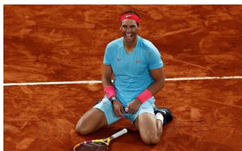
Rafa Nadal después de vencer en la reciente edición de Roland Garros.