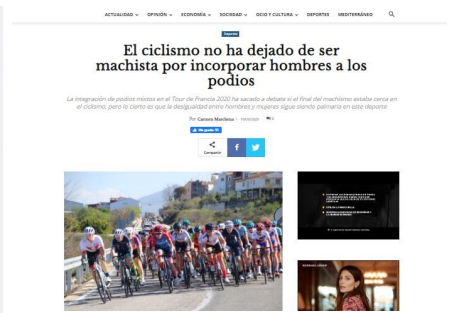
Diario 16. El ciclismo no ha dejado de ser machista por incorporar hombres a los podios