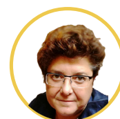
Mar Mas Presidenta

¡Sigamos! Las metas están para conquistarlas.