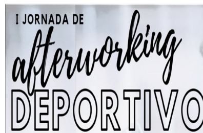
La AMDP organizó el pasado 18 de diciembre la primera jornada de after working deportivo.