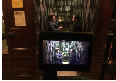
TV3. Rodaje documental Mujer y Deporte. Cuatro Gatos. leer