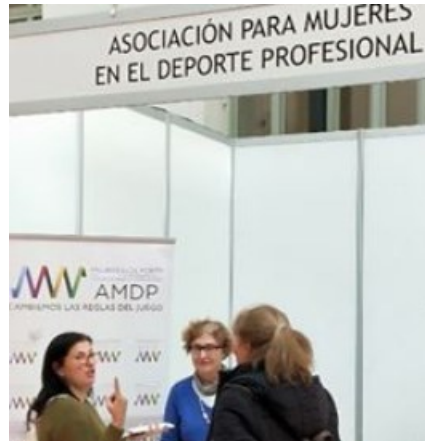
Participación en Feria del Asociacionismo organizada por el Ayuntamiento de Madrid.