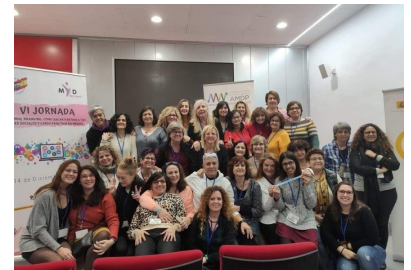
Participación en la IV Jornada de Personal Branding. Curso práctico de Medios. Organizada por la Federación Española de Deportes para Sordos.