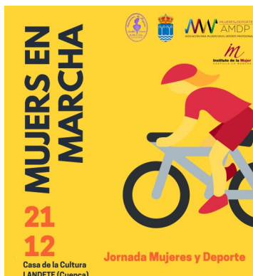
La AMDP organizó la Jornada Mujeres en Marcha. Landete. Cuenca.