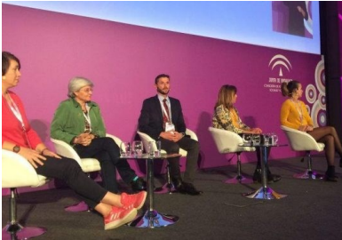
La AMDP participa en el X Congreso Internacional para el estudio de la violencia contra las mujeres.