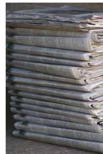
DO har analyserat den svenska mediebildens av muslimer.

Den analys som DO har låtit genomföra kan inte sägas ge en statistiskt fastställd och allmänt giltig sanning om den svenska mediebildens av muslimer. Till det behövs mer omfattande forskning. Men rapporten ger en tydlig och aktuell indikation på hur musli-