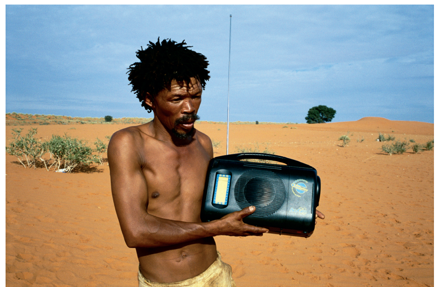
Bushman i Kalahariöknen.

Medverkande: Representanter för regering och sameting,