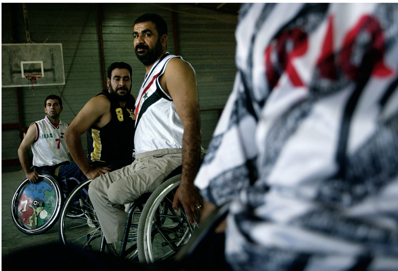
Rullstolsbasket i Irak, alla har rätt till hälsa.