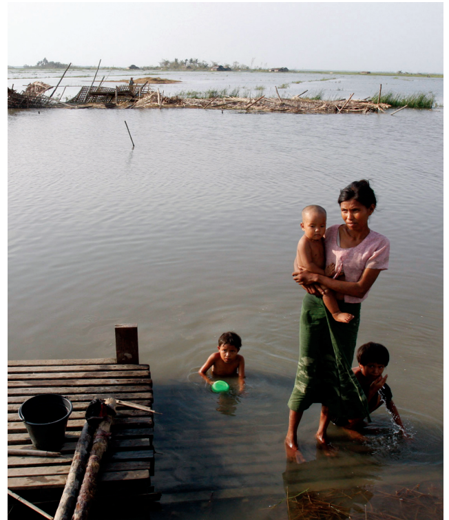
Där kvinnan står stod tidigare hennes hus. Vad händer med vår rätt till bostad i klimatförändringarnas tid?

Burma: när militärdiktaturen skjuter demonstranter är det inte vårt land som håller i geväret. Men när hundratu-