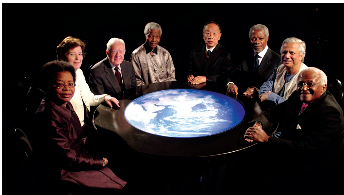
I The Elders har en namnkunnet skara världsledare samlats för att likt gamla tiders byäldste erbjuda råd och ledning till oss invånare i den globala byn. The Elders består av Graça Machel, Mary Robinson, Jimmy Carter, Nelson Mandela, Li Xiaoxing, Kofi Annan, Mohammad Yunus, Desmond Tutu. I gruppen ingår också Ela Bhatt, Gro Brundtland, Lakhdar Brahimi, Fernando Henrique Cardoso och Aung San Suu Kyi.