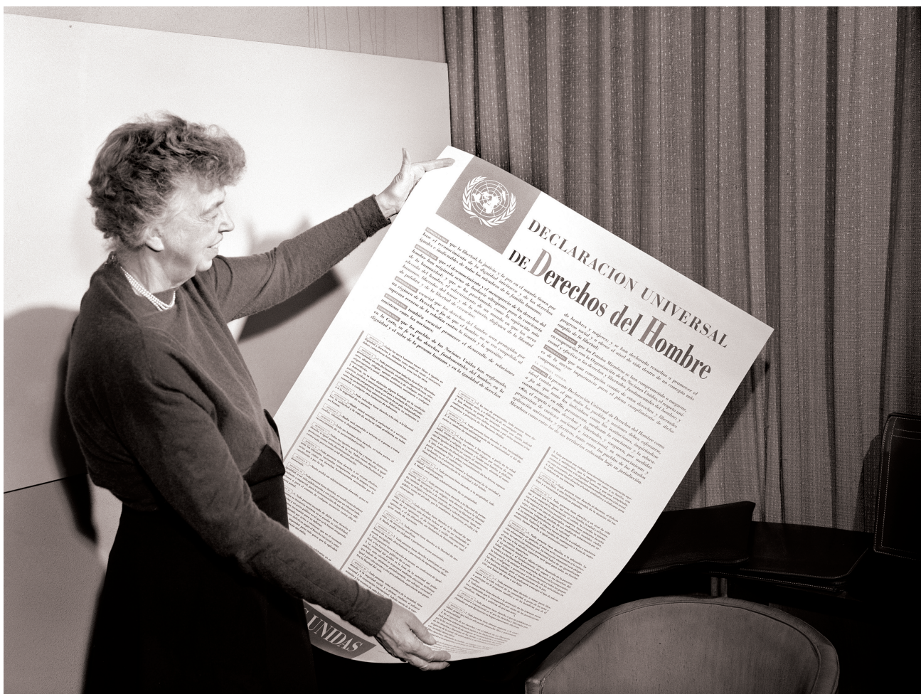
Eleanor Roosevelt med FN:s förklaring om de mänskliga rättigheterna i händerna.