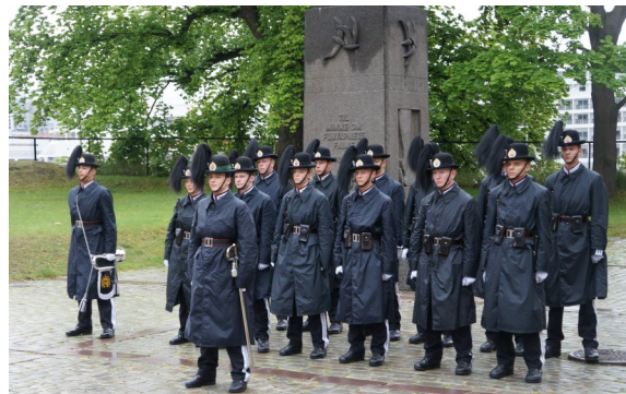
Æresvakt fra HMK Garde var på plass!