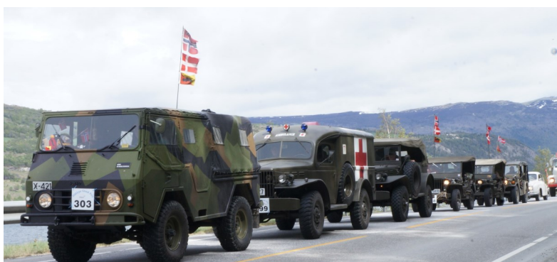
Vår kolonne under en stopp.