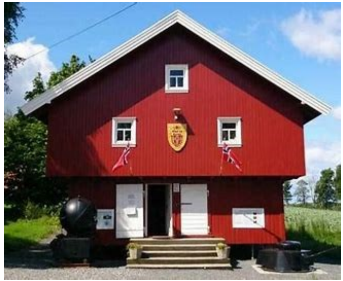
Et flott militærmuseum i et lite stabbur.

Noen av de mange tingene knyttet til Hjemmefronten, men her er det store mengder interessante ting.