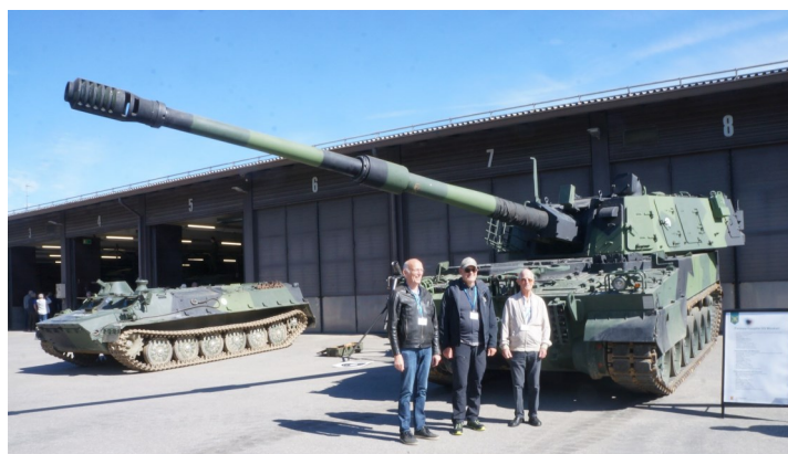
En panter studeres av deltakerne og det var mye annet grovt å se også.