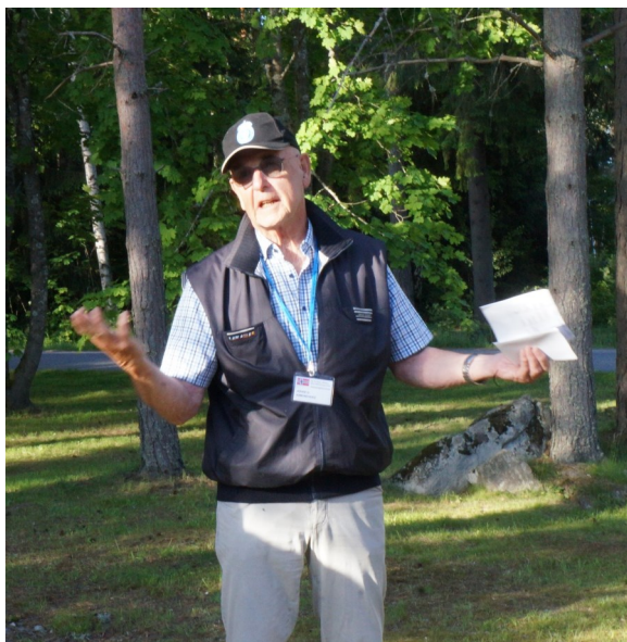
Presidenten instruerer sine mannskaper

Fredag var avsatt til grundige orienteringer i leiren, og vi fikk bese verksteder og ikke minst et omfattende opplegg av simulatorer for kjøring og skyting med stridsvogn. Her var det også omfattende datasimulatorer hvor store og mindre avdelinger kunne øve ved hjelp av avanserte «dataspill». Så fikk vi kose oss med å klatre på og inn i en rekke forskjellige pansrede kjøretøy, en Leopard kom kjørende og mannskapet viste oss villig sine kunnskaper om materiellet de behersket. Siste stopp var anti-aircraft avdelingen som disponerte avanserte radarstyrte rakettbatterier til beskyttelse av panserbrigaden. Etter lunch besøkte vi det store pansermuseet utenfor leiren. Her var det en masse godbiter for kavalerister, og det lyste formelig i øynene på deltagerne fra Norske Dragoner. En tidlig T-34,