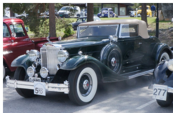
Nevnte nydelige Packard 1933 modell.