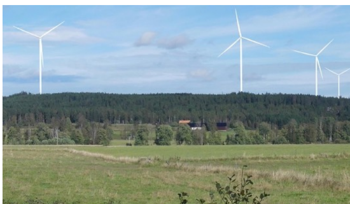
Vy från Gammelbo gården mot öster. I mitten Stora Norrbo