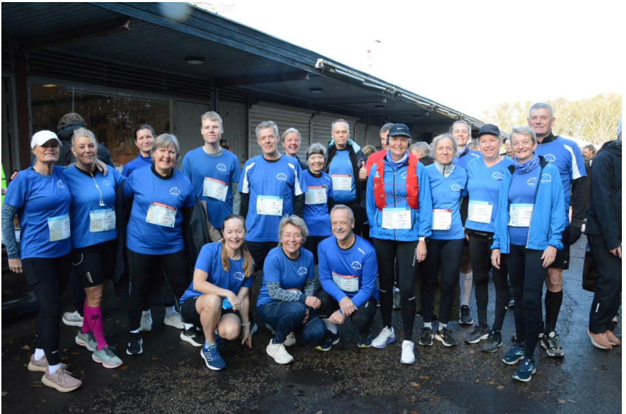
MKA deltagere i Lufthavnen og Strandparken rundt 2025