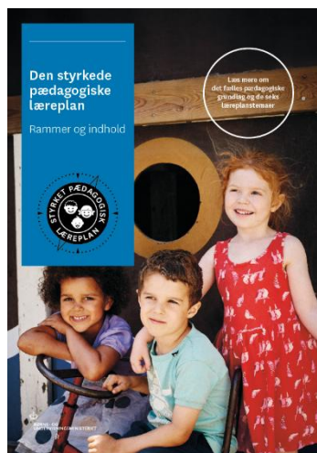
Den styrkede pædagogiske læreplan. Rammer og indhold

Inden for de krav, der følger af dagtilbudsloven, er det op til jer at beslutte, hvordan I konkret vil arbejde med den pædagogiske læreplan. Jeres læreplan skal være et dynamisk og meningsfuldt dokument, som peger fremad, og som I kan bruge aktivt i den løbende udvikling af den pædagogiske kvalitet og jeres pædagogiske praksis.