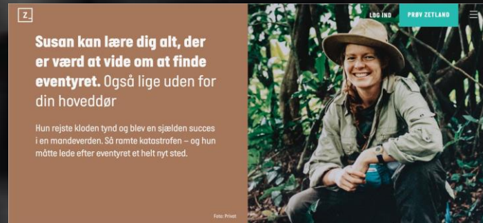
Den digitale avis Zetland