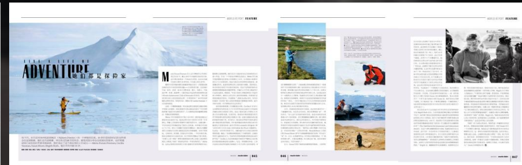
Magasinet Marie Claire China