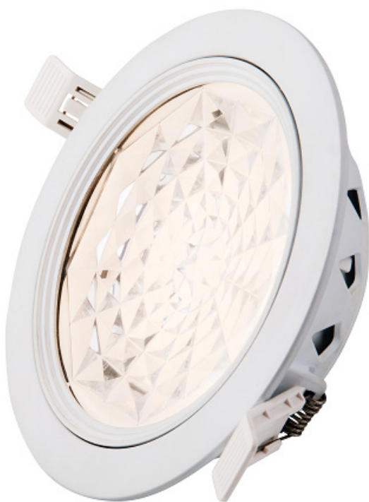
TOP DOWNLIGHT 8W Ø170MM