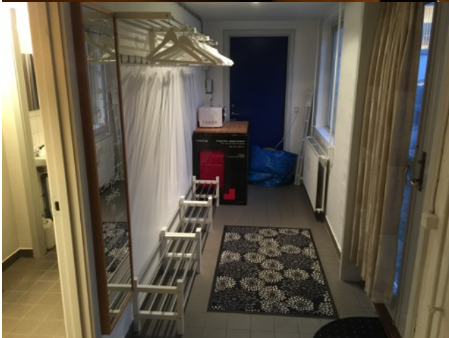
Allan Ulrich Thomsen - 2015