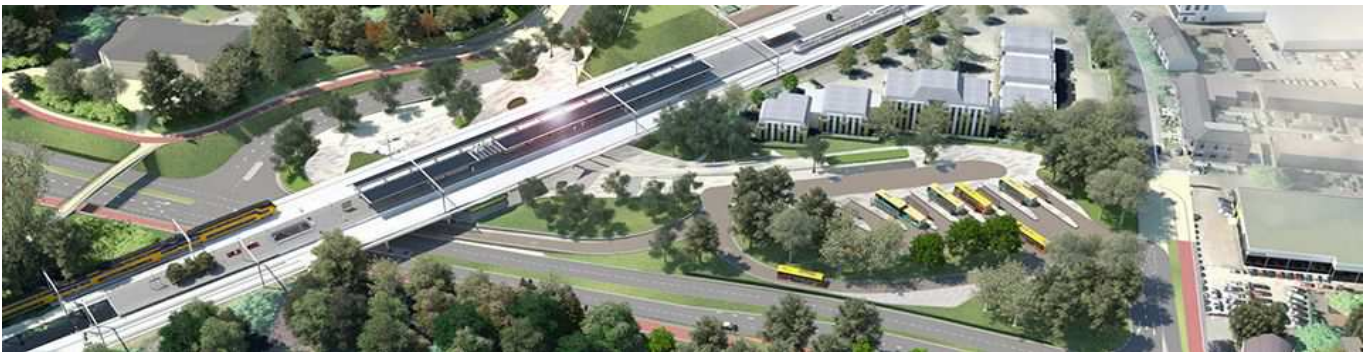
artist impression nieuwe situatie

Het stationsgebied ligt, net als de landgoederen de Reehorst, Bloemenheuvel, Bornia en De Breul, in de Ecologische Hoofdstructuur. De aanleg van een tunnel verstoort de corridorfunctie van de EHS in dit gebied (dat loopt tot aan de A12, richting Bunnik waar een wildtunneltje is aangelegd). Dat betekent dat er gecompenseerd moet worden. Op dit moment is nog niet duidelijk op welke manier dat zal gebeuren.