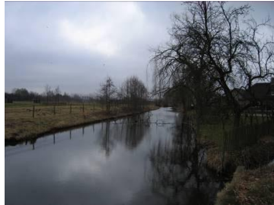
Fig. De Biltse Grift in de omgeving van de Bisschopsweg (uit rapport provincie/Grontmij. Deelgebied Zeist-Bunnik, 2011)

Dan ben je de bijzondere kwaliteiten die zo kenmerkend zijn voor dit gebied, kwijt. Deze verminderen sterk aan waarde en dat heeft weer gevolgen voor het economische vestigingsklimaat van de omliggende kernen.