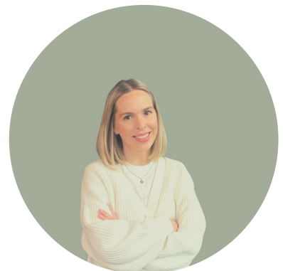
Laura Becher (Grafische Gestaltung)