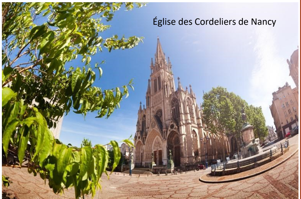
Église des Cordeliers de Nancy

Wanneer je langs de Église des Cordeliers de Nancy loopt is ook deze kerk zeker een bezoekje waard. Deze katholieke kerk werd in de 15de-eeuw gebouwd met een combinatie van Gotische en Renaissance stijlen. Het was onderdeel van een Franciscaans klooster dat onder de bescherming van de hertogen van Lotharingen viel. Door deze band werden verschillende hertogen hier begraven. Nadat Lotharingen onder de koninklijke Franse macht kwam te vallen werd het meerdere malen bezocht door grote historische figuren, zoals Marie-Antoinette en keizer Franz Joseph I van Oostenrijk. In 1951 trouwden de aartshertog Otto von Habsburg-Lothringen met prinses Regina van Saxe-Meiningen in de kerk.