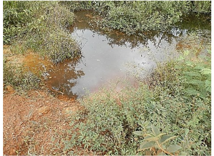
Weg naar hout kamp Cacao L N 04°31'49,5" W 052°30'01,8"

De eerste plaats enkel Laimosemion agilae , de tweede plaats agilae en xiphidius . Het is nu stilaan tijd om huiswaarts te rijden, hier is het ook rond 19 u pikdonker. We moeten een stuk door de bergen om op de N2 te komen en liefst met daglicht.