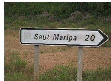
N2 afslag Saut Maripa. Ter hoogte van ST Georges