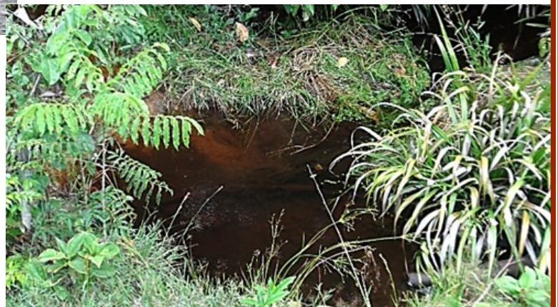
N2 PK 77+300 N 04°20'53,9" W 052°15'24,2"

We vangen de terugtocht aan en nemen ons voor onderweg even te stoppen aan een vangplaats op de N2 ter hoogte van km paal 77.3 en treffen hier Laimosemion agilae, Anablepsiodes igneus, Pyrrhulina filamentosa en Apistogramma gossei aan.