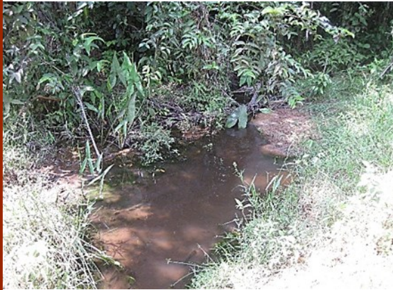
Retour Maripa Falls 257m N 03°48'47,4" W 051°52'27,7"

We zijn nog maar net 170 m op de terugweg en trekken er net de netten op uit, we doen verwoede pogingen om wat te vangen. We treffen hier Laimosemion agilae en Laimosemion xiphidius aan.