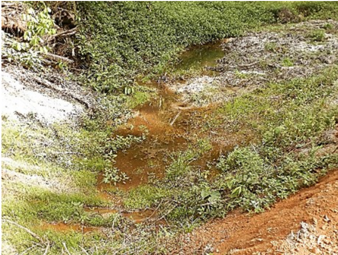
Weg naar hout kamp Cacao L N 04°30'36,4" W 052°30'30,7"

De 2 plaatsen die water bevatten gaan we dan ook nader bekijken.