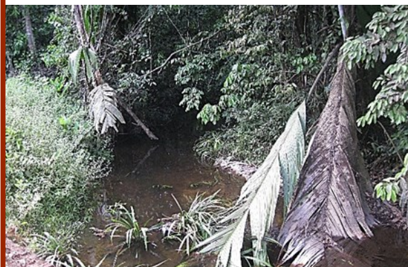
Retour Maripa Falls 1477m N 03°49'14,2" W 051°52'46,6"

Onze volgende stopplaats is 257 m verder, hier vangen we enkel Laimosemion geayi .