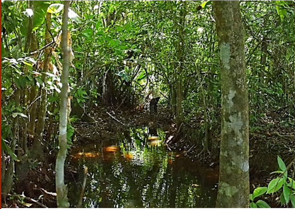
Aff. La Carapa N04°55'03,7" W052°27'32,3"

28 oktober. Na een welverdiende nachtrust en een stevig ontbijt bekijken we de planning voor morgen.