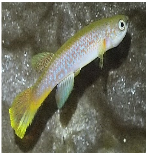
Rivulus Agilae Bakhuis gebergte

Bij het uitdrogen vormt de bovenlaag een bescherming of afsluiting zodat het gedeelte onder deze laag niet uitdroogt, de eitjes vertoeven dan ook in een vochtige omgeving. Sommige soorten hebben een ontwikkelingsperiode van een jaar of meer. De soorten die ik houd zitten tussen de 3 en 5 weken. Als dit uw interesse wekt kijk dan in gespecialiseerde literatuur.