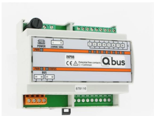
Figuur 1 : Ingangsmodule INP08