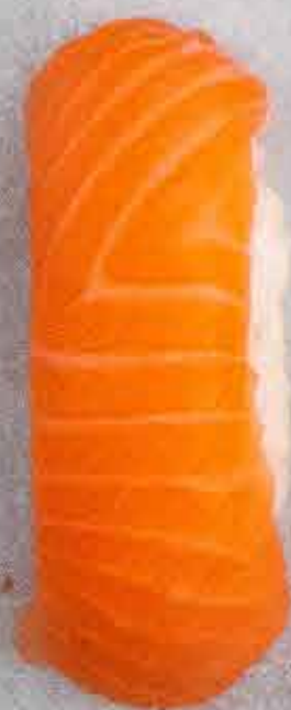
Laks, 43 kr. (Med hvidløg +3