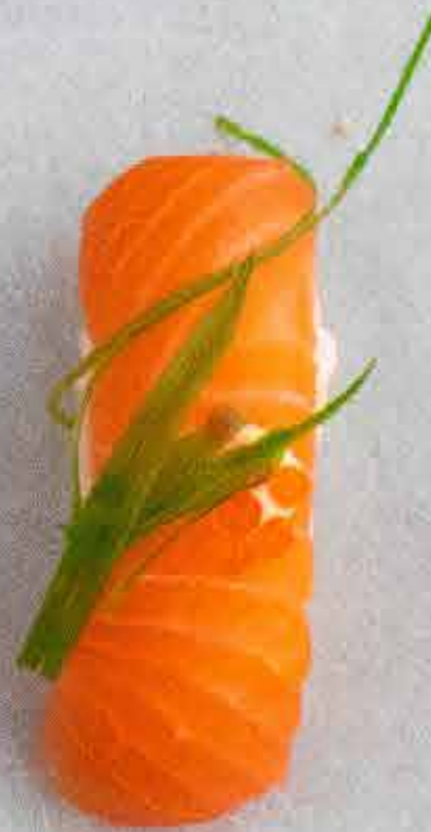
Laks, 46 kr. Med kewpie, rogn og