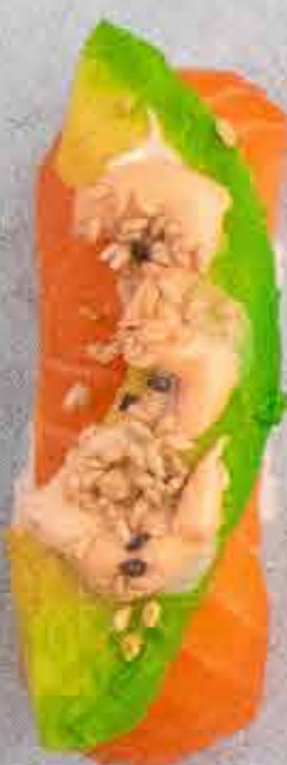
Laks, 46 kr. Med avocado og chilimayo