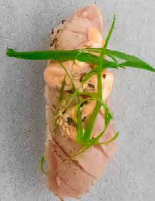
Grillet tun, 48 kr. Med chilimayo og forårsløg