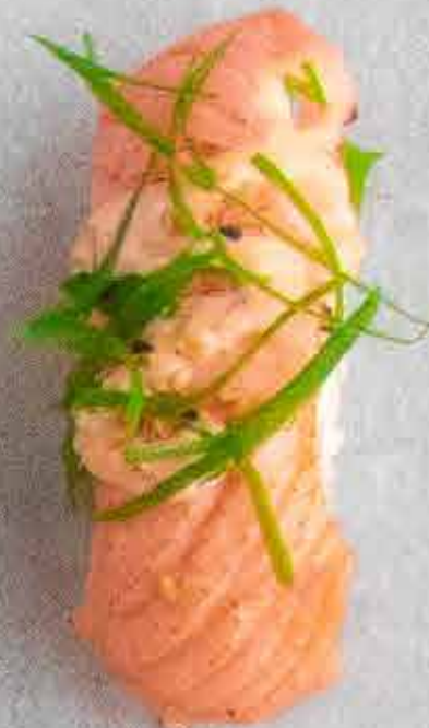
Grillet laks, 46 kr. Med chilimayo og forårsløg