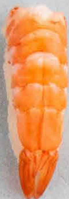
Tigerreje, 46 kr.