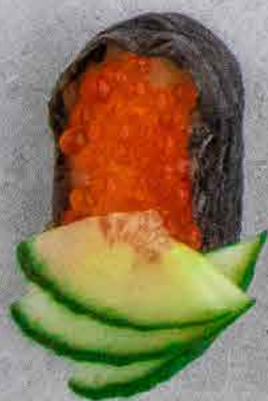
Gunkan med Lak- serogn, 48 kr.