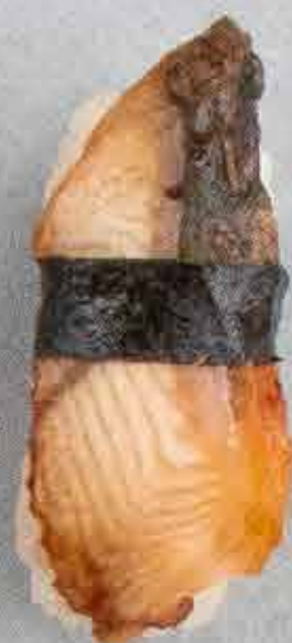
Ål, 48 kr.