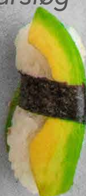
Avocado, 43 kr.