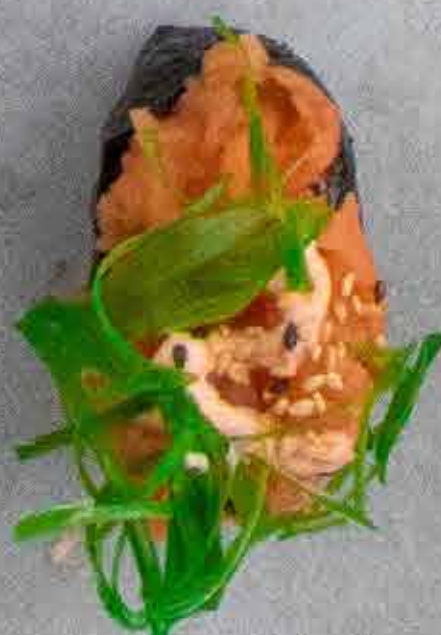
Gunkan med Sparkling Salmon, 45 kr.