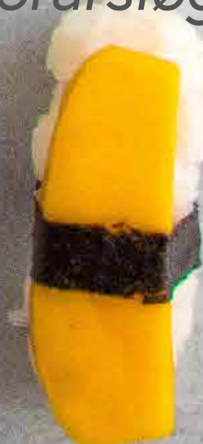
Mango, 43 kr.