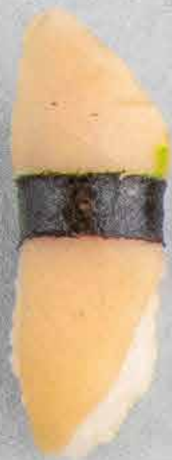
Kingfish, 48 kr.