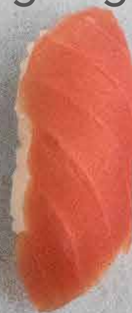
Tun, 45 kr. (Med hvidløg +3 kr.)