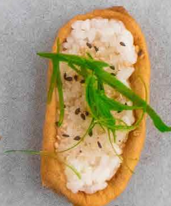
Inari, 43 kr. Med sesam og forårsløg