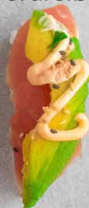
Tun, 48 kr. Med avocado og chilimayo