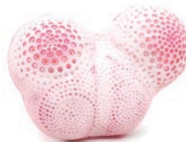
SCHMUCK - Yael Olave Munizaga