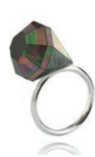
FRAME - Melanie Georgacopoulou