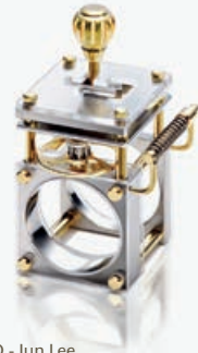
Gallery O - Jun Lee