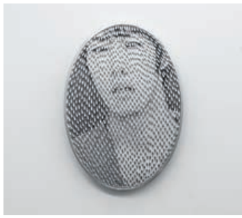
SCHMUCK - Takayoshi Terajima