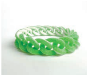
TALENTE - Benedict Haener