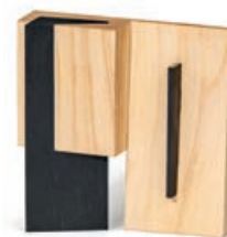
TALENTE - Le Woon Lim

Die Auswahl wurde von der Abteilung für Messen und Ausstellungen der Handwerkskammer für München und Oberbayern zusammengestellt, messe@hwk-muenchen.de