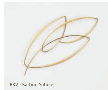
BKV - Kathrin Sättele

im Ruffinihaus am Rindermarkt 10, München »02