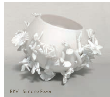
BKV - Simone Fezer