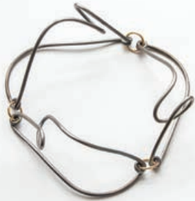
Galerie Marzee - Dorothea Prühl