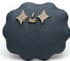
Galerie Noel Guyomarc'h - Aurélie Guillaume