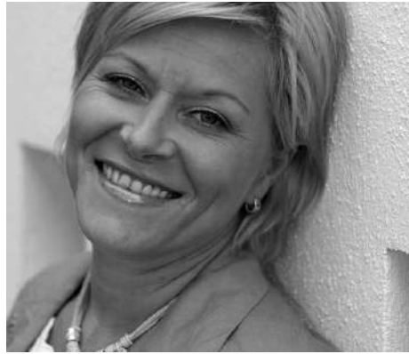
SIV JENSEN ■

eller i hvert fald kun gøre efter visse overvejelser. En årsag til at være forsigtig med parallellerne er at Dansk Folkeparti ikke har den markedsliberale automattilgang til økonomisk politik som norske FRP. Tværtom optræder jo Dansk Folkeparti som VK-regeringens sociale revser. Hvorvidt det er troværdigt og konsistent, kan diskuteres. Det forhindrer bare ikke at det er en del af partiets selvforståelse at fremstå som socialdemokratiet "classic", og at den forståelse er spredt et pænt stykke uden for partiets indre kredse.