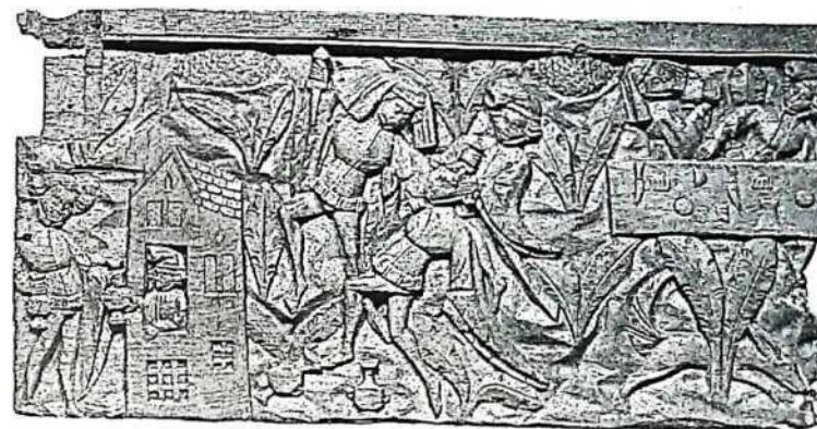
En "fortællende" udskæring på en kiste fra ca. 1410. Motivet er en scene fra Chaucer's Canterbury Tales, The Pardoner's Tale.

Kister forekommer i snart sagt enhver størrelse, fra de flere meter lange, meget tunge og rummelige, til helt små skrin. Overordnet ser det ud til, at kister blev brugt til at opbevare alt det, der ikke kunne være andre steder. Klæder, sengetøj, vokslys, pelsværk, fornemt keramik, personlige ejendele, handelsvarer samt en mængde andre ting - alt, hvad der var for stort, småt, skrøbeligt, kostbart eller privat til at ligge fremme på en hylde. Kisten var en relativt sikker opbevaring, da de som hovedregel var lavet af ret solidt tømmer, og forsynet med sindige og kraftige låse. I en kiste var tingene rimeligt beskyttet mod fugt, støv, frost, mus, tyveri, uheld, og den aldrig helt fraværende røg fra ildstedet. Endvidere var kister forholdsvis nemme at transportere (omend de lidt større har været djævelsk tunge at flytte rundt på), og de har da også været anvendt som en