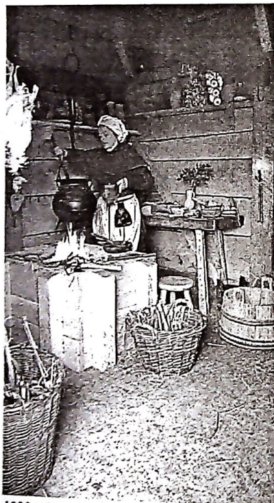
1300-tallets samtalekøkken, oven i købet med den i dag så fashionable "fritstående kogeø"... lædersmedens hus på Middelaldercentret.

Når moderne arkitekter nu forsøger at arbejde sig væk fra 60'ernes og 70'ernes parcelhusfilosofi, hvor hvert enkelt familiemedlem blev tildelt sin egen lille aflukkede celle (en model, som i parantes bemærket faktisk kan tolkes som en art middelalderens klosterbyggeri en miniature ), og erstatte det med store fælles-