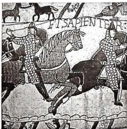
Det mest berømte tjældetæppe af alle - Bayeux-tæppet fra ca. 1070.

var ikke mindre forfængelige end vi er i dag, og hvis man var velstående nok til at have overskud til det gik man meget op i sin personlige fremtoning. Spejle kendes som en slags "lommespejle", der kunne opbevares i en pung eller bæltetaske. De er monteret i en lille ramme eller indfatning, typisk af bly/tin, sjældnere sølv, som kunne lukkes for at beskytte glasset. Men egentlige vægsspejle findes også bevaret, og optræder endvidere relativt hyppigt i billedkildene. Vægsspejle var ofte konvekse, og bestod af en halvkugleformet spejlflade, der stak ud i lokalet.