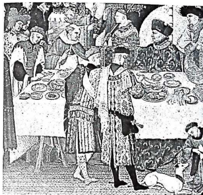
Selv i meget rige og fornemme hjem forekom simple borde, der blot bestod af en bordplade, lagt på bukke. Her optræder det således hos hertug Jean de Berry, bror til den franske kong Charles V. Bemærk bukkens ben, der stikker frem under dugen.

Fritstående bænke kendes dog også, endog i ret avancerede designs, der af udseende kan minde en del om slagbænke. Forsynet med ryglæn, der tilmed i visse tilfælde er monteret således at de