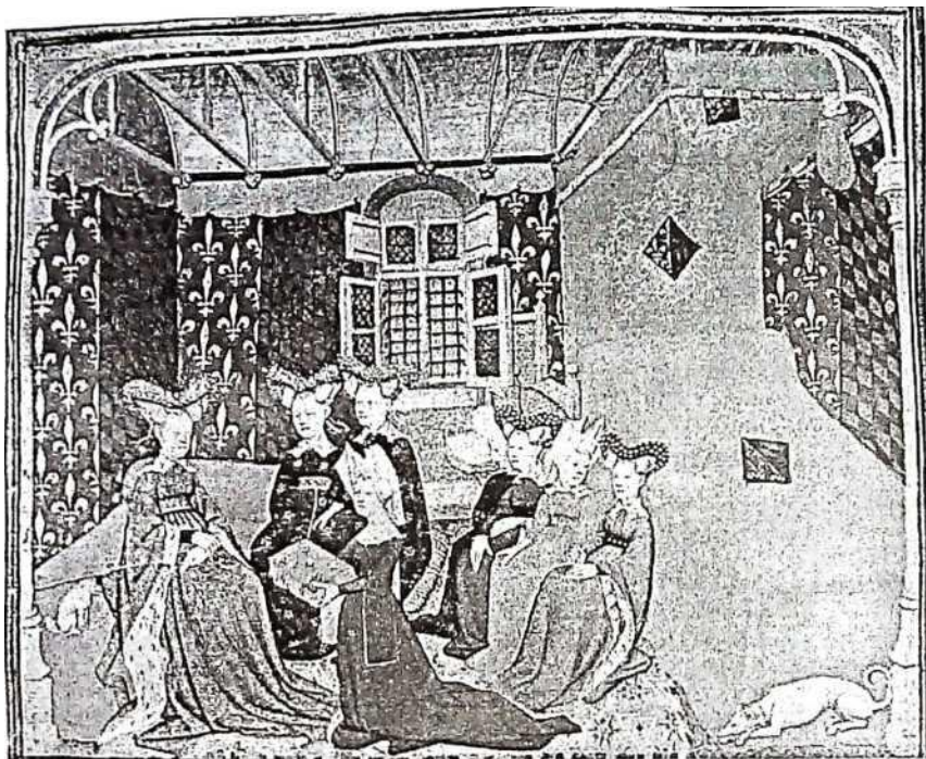
Klædebaner hængt op på væggen har forekommet i alle sociale lag, men hos overklassen kunne de samtidig tjene til udsmykning, som her hos en tysk fyrstinde. Originalen er blå, med fleur-de-lys i guld, og klædet har været umådeligt kostbart.

var ikke mindre forfængelige end vi er i dag, og hvis man var velstående nok til at have overskud til det gik man meget op i sin personlige fremtoning. Spejle kendes som en slags "lommespejle", der kunne opbevares i en pung eller bæltetaske. De er monteret i en lille ramme eller indfatning, typisk af bly/tin, sjældnere sølv, som kunne lukkes for at beskytte glasset. Men egentlige vægsspejle findes også bevaret, og optræder endvidere relativt hyppigt i billedkildene. Vægsspejle var ofte konvekse, og bestod af en halvkugleformet spejlflade, der stak ud i lokalet.