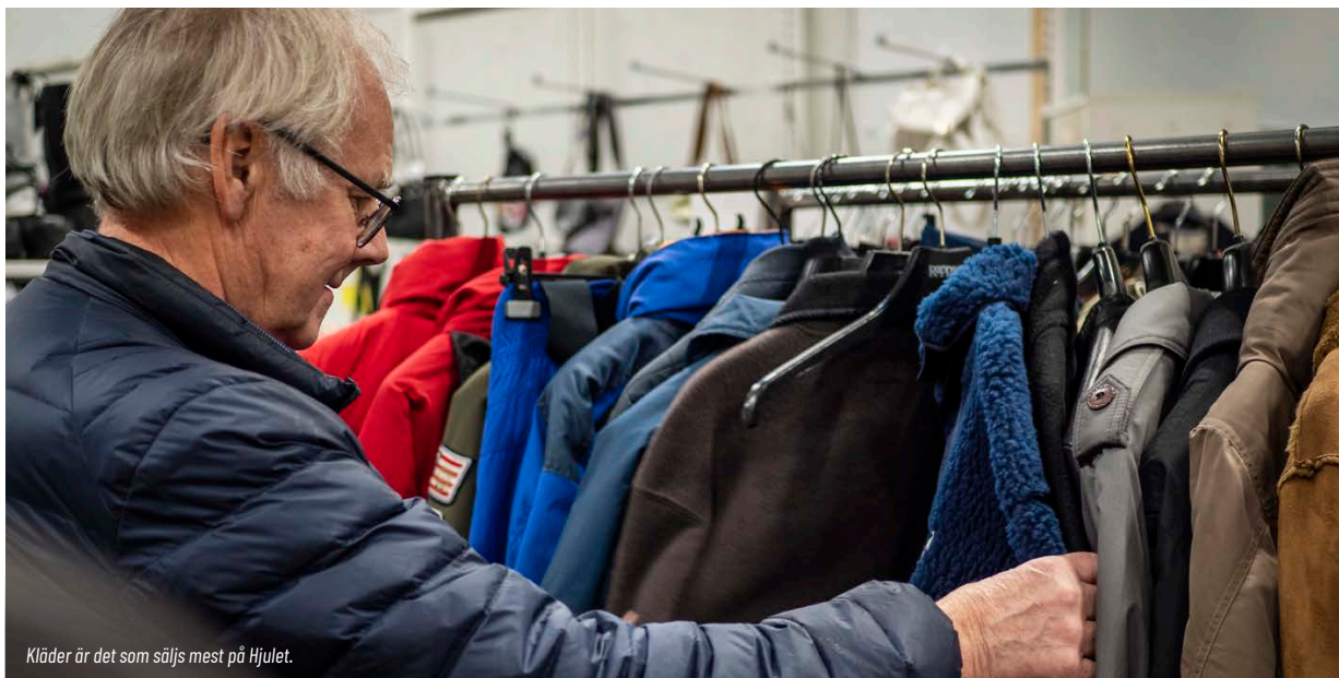
Kläder är det som säljs mest på Hjulet.