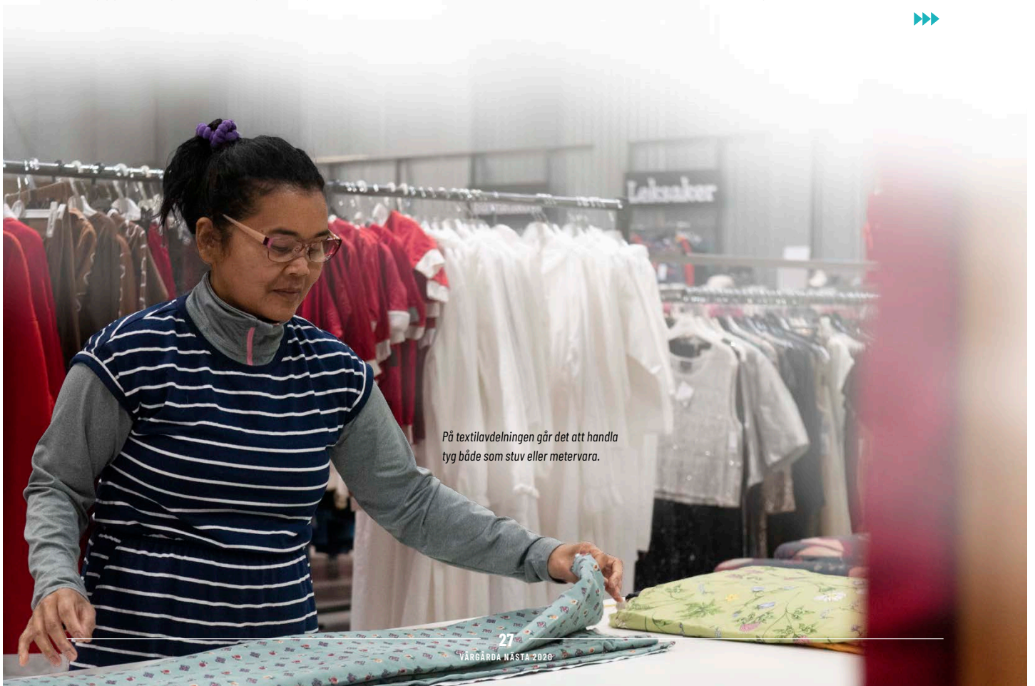
På textilavdelningen går det att handla tyg både som stuv eller metervera.