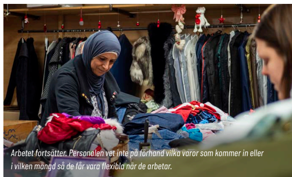
Arbetet fortsätter. Personalen vet inte på förhand vilka varor som kommer in eller i vilken mängd så de får vara flexibla när de arbetar.