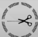
Rifinitura senza cuciture