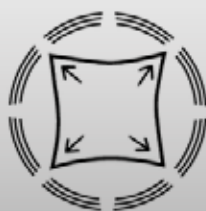
Elastico in tutte le direzioni