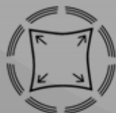
Elastico in tutte le direzioni