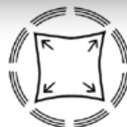
Elastico in 4 sensi