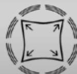
Elastico in tutte le direzioni