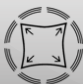
Elastico in tutte le direzioni