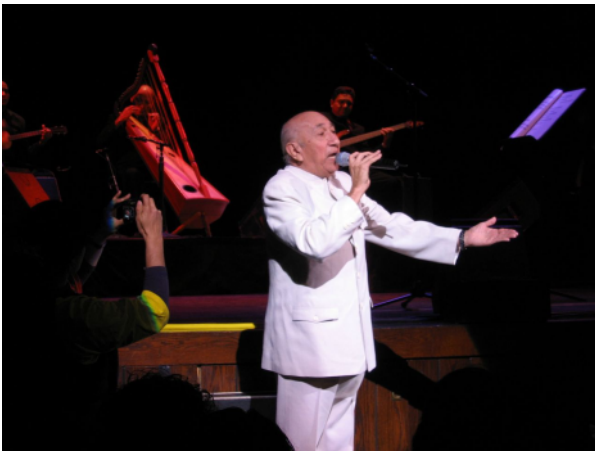
Simón Díaz

– Okej, det var allt för idag! Vi hoppas att ni har lärt er något nytt om latinamerikansk musik. Vi ses i nästa avsnitt som kommer att handla om gastronomi. Tack så mycket. Hej då!