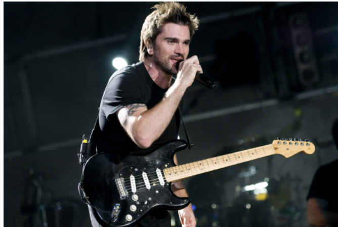
Juanes

– Mi mamá es colombiana de una ciudad que se llama Cartagena, y queda en el caribe colombiano. En el caribe se escucha la cumbia, el mapalé y el vallenato. Uno de los grandes artistas colombianos fue Joe Arroyo, él también es de Cartagena y dominó la salsa y la música tropical hasta ganó un Grammy Latino el 2011. Otro artista conocido del caribe es Carlos Vives de Santa Marta, A mi mama le gustaba mucho el álbum “La tierra del olvido” y su canción “La gota fría”. Un cantante que también se escuchaba mucho en Colombia era Juanes que viene de Medellín y eso no está en el caribe, pero en la provincia montañosa de Antioquia. Él se hizo muy conocido en todo el mundo con la canción “La Camisa Negra”.