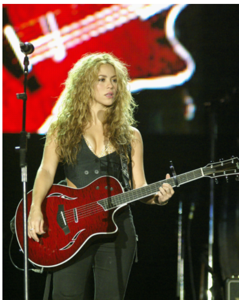
"Shakira Rio 03" by Original uploaded to www.arteyfotografia.com as Shakira Rock in Rio 08 001 by Andres.Arranz.

Om du har förslag på förbättringar, nya teman etc. kan du skicka dina förslag och idéer till: podcast@escandinavo.com