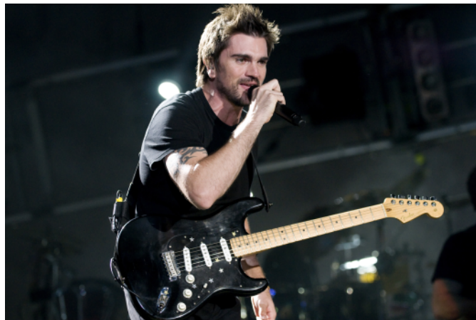
Juanes

– Mi mamá es colombiana de una ciudad que se llama Cartagena, y queda en el caribe colombiano. En el caribe se escucha la cumbia, el mapalé y el vallenato. Uno de los grandes artistas colombianos fue Joe Arroyo, él también es de Cartagena y dominó la salsa y la música tropical hasta ganó un Grammy Latino el 2011. Otro artista conocido del caribe es Carlos Vives de Santa Marta, a mi mamá le gustaba mucho el álbum “La tierra del olvido” y su canción “La gota fría”. Un cantante que también se escuchaba mucho en Colombia era Juanes que viene de Medellín y eso no está en el caribe, pero en la provincia montañosa de Antioquia. Él se hizo muy conocido en todo el mundo con la canción “La Camisa Negra”.