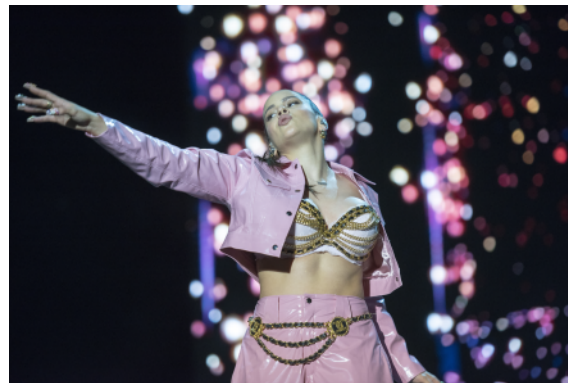
Rosalía - BILBAO BBK LIVE 2019

– ¡Gracias Olga! Me encantaría decirte que tenemos nuestros propios famosos, pero natales de Gran Canaria no tenemos muchos que sigan vivos. Por eso os contaré sobre la famosa barcelonesa Rosalía de la península. A los solo 25 años consiguió romper las listas con su primer sencillo “Malamente” de su disco “El Mal Querer” de 2018, con su mezcla de estilo de pop, flamenco, reggaeton,