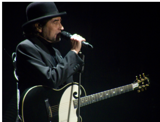
"Joaquín Sabina - Gira Vinagre y Rosas (Madrid 15/12/2009)"