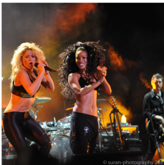
"Shakira & Dancer" by suran2007 is licensed under CC BY 2.0.

– Jo, Olga, i Colombia lyssnar de på all slags musik, men vi har några mycket kända artister från mitt land. Till exempel en kvinna som är mycket känd i många