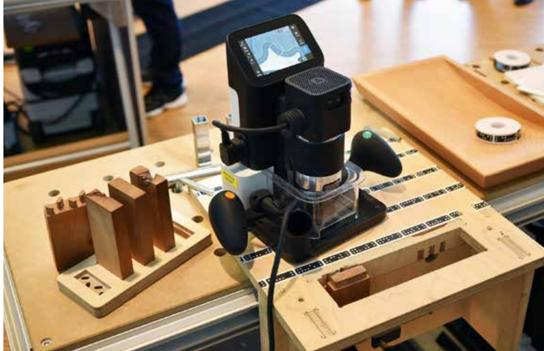
Den nya överhandsfräsen Shaper, närmast att liknas vid en CNS-styrd fräsmaskin som gör svåra jobb riktigt roliga.

omtyckta. Man har valt att sälja genom exklusiva, noga utvalda återförsäljare. Eller som de säger själva: En stark marknad behöver starka varumärken, och riktigt begejrad kan du aldrig bli om du inte är 100 procent övertygad om elhandverktygens förträfflighet, det går helt enkelt inte på något annat sätt!