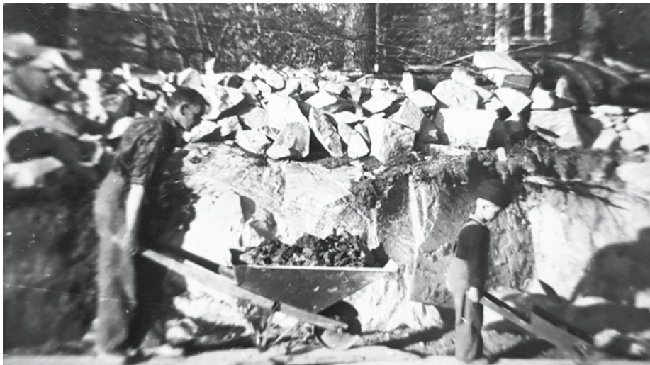
Skribentens far och yngre bror vid det kommande egna hemmet.

Att köpa en tomt och bygga själv var plötsligt möjligt för arbetsamma och sköttsamma familjer med begränsade inkomster.