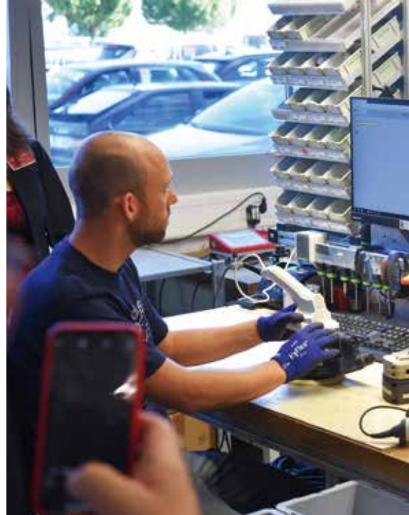
Festool satsar stort på service. 155 medarbetare arbetar endast med det.

och med början i Tyskland. Vad priset blir för en sådant lyxutrustat arbetsredskap återstår att se