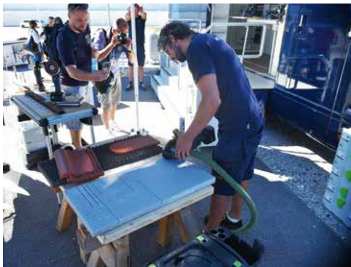
Många besökare samlades kring demonstrationerna av nya verktyg. Här en diamantkap. Systainerlådor syns till höger i bilden.

Företaget Tanos som säljer Sustainersys-