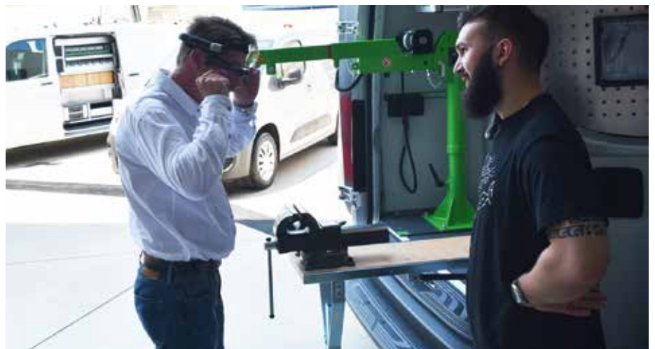
Provning av smarta glasögon