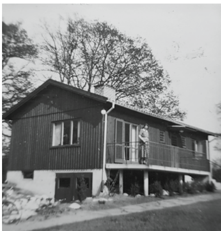
Det egna hemmet som blev verklighet.

Det gick inte att ta miste på föräldrarnas stolthet. Från trängsel i en hyrd villaövervåning utan eget badrum till egen tomt, eget hus, eget rum till mig och min bror, välutrustat badrum och rymlig källare med tvättstuga och garage. De, liksom 10 000-tals andra i samma situation, tyckte det egna hemmet var väl värt allt slit och släp, uppoffringar, umbäranden och skulder med avbetalningar och räntor.