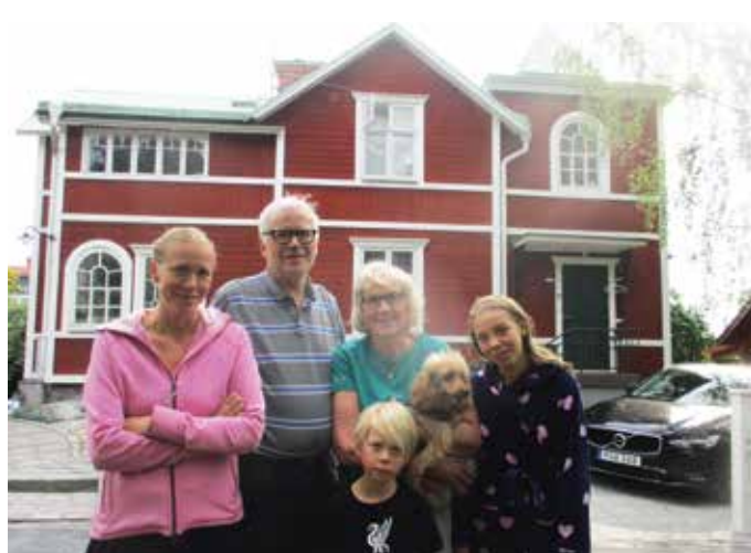
En morgon från Duvbo – ett av Stockholms äldsta egnahemsområden. Tre generationer i fina Duvbo.