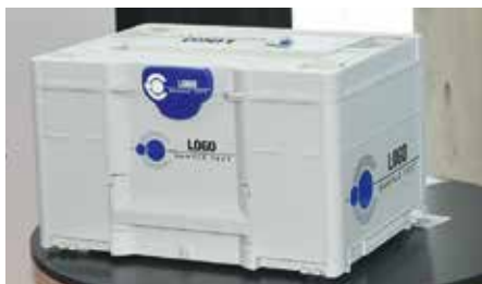
Går att få sitt namn på.

Bott visade en närmast maximalt utrustad Van, med sinnrik inredning och röststyrning för många funktioner. Till exempel för att tända belysningen, hitta speciella verktyg eller skruvar, genom att illuminera – tända upp de lådor där det du