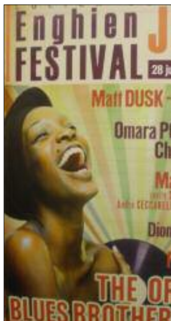
Uno gillar jazz.

Att ha overseende är en viktig faktor för framgång. Sådant har nog äldre mer av än yngre. Goda människor är genuina, intelligenta. Ondska är en konsekvens av okunskap.