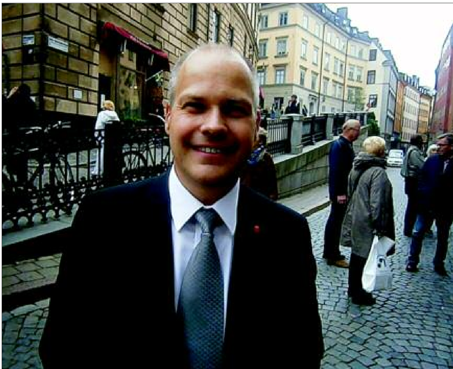
Morgan Johansson, justitieminister som fick förnyat förtroende.