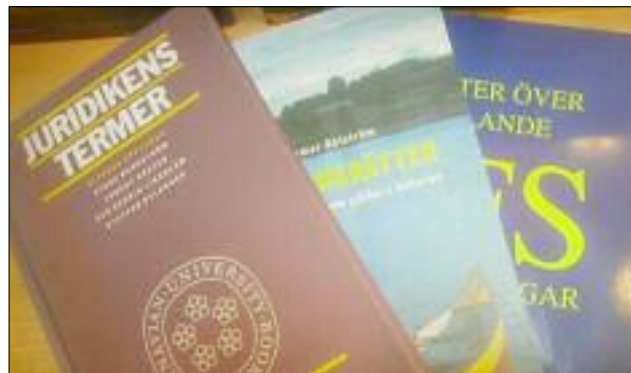
I Eskilstuna anordnas möten som rör grundläggande kunskap om rättsprocessen.

Flickans två föräldrar döms till villkorlig dom för försök till äktenskapstvång. Enligt domen har föräldrarna utnyttjat flickans utsatta situation för att försöka förmå henne att ingå den äktenskapsliknande förbindelsen.