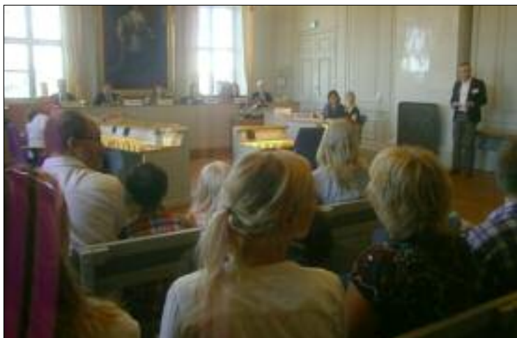
Domstolens dag vid Svea Hovrätt. Ett sätt för allmänheten att bli bättre bekant med svenskt rättsväsende.

Nämndemannen kommer därför inte att delta i den dömande verksamheten mer.