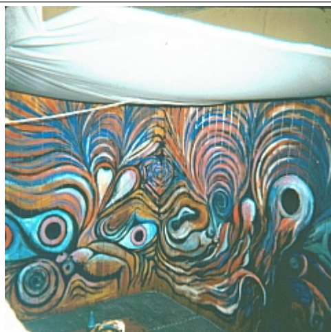
Kompe-lokum med ”kompe-lusker” Nuser malet på væggen i midtergangen..