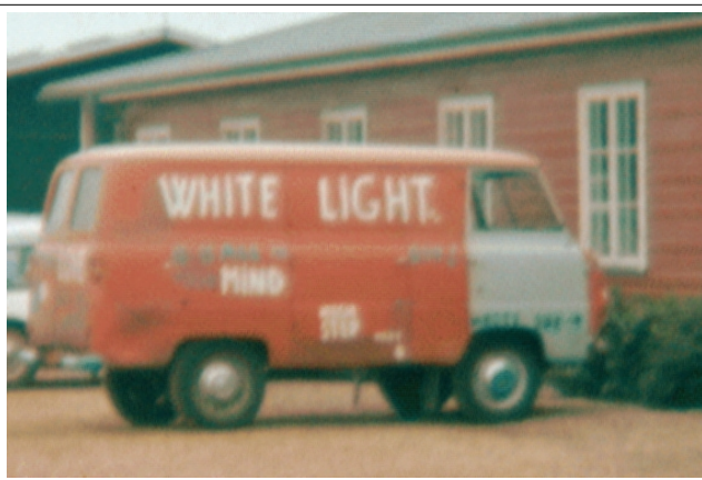
Ford Thames Freighter