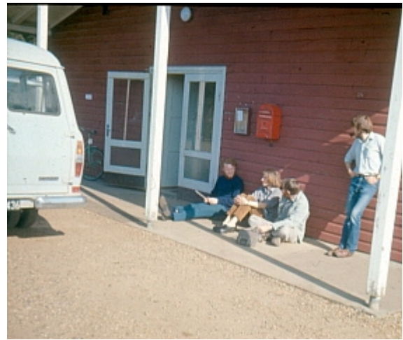
Kompedal militær-nægterlejr: Min røde barak