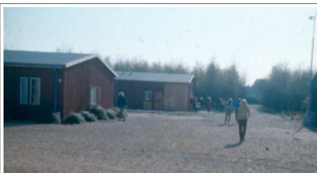
Fjerneste barak med fælles musik-rum og gymnastiksal (til basket-ball o.a.)