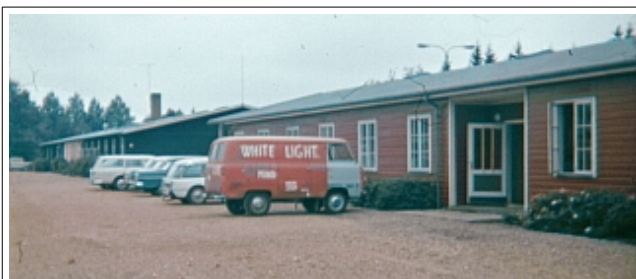
Min røde barak og min bil. Sort barak rummer spisesal, tv-stue (med slikbutik)

..så den butik forbliver een-mands drevet.