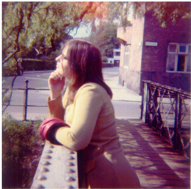
Her er hun ved åen tæt på hovedbiblioteket.

Til højre ved en skurvogn en torvedag ved domkirken.