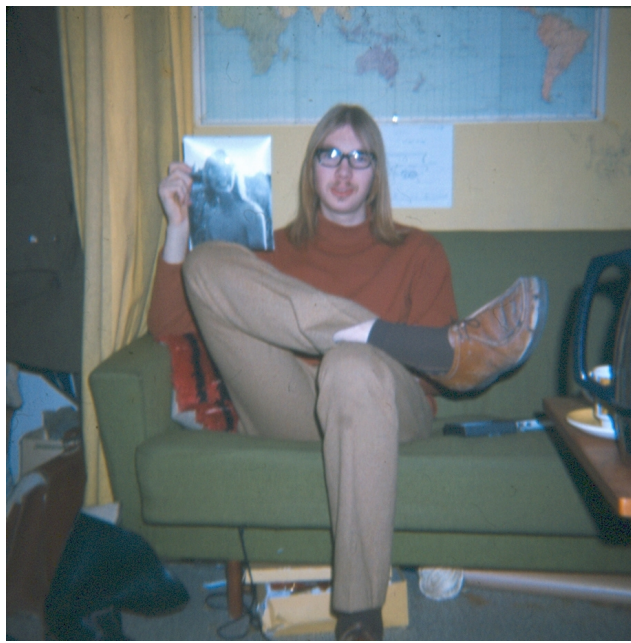
Mit verdenskort med planer om jordomrejse