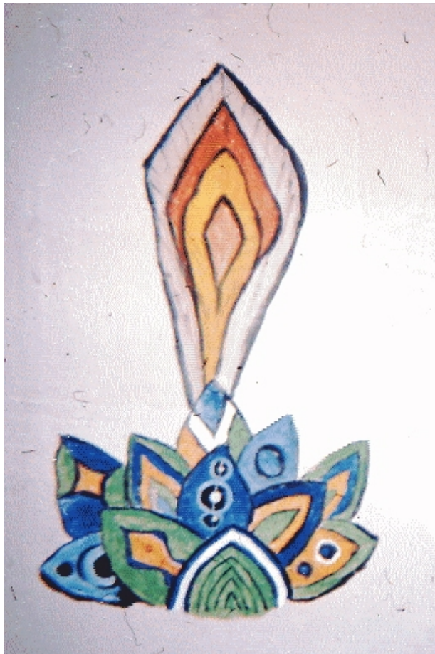
Bodils "blomst". På den modsatte væg.