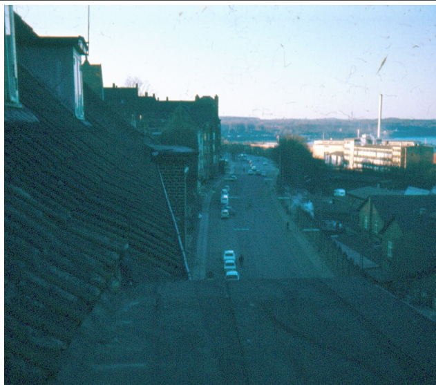
Her er udsigten fra "altanen"