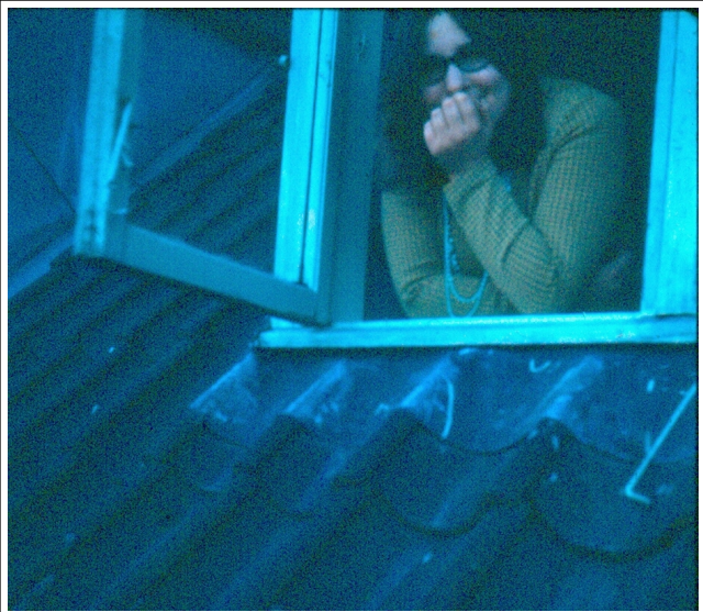
Jeg håbede, at hun ville lukke mig ind igen.