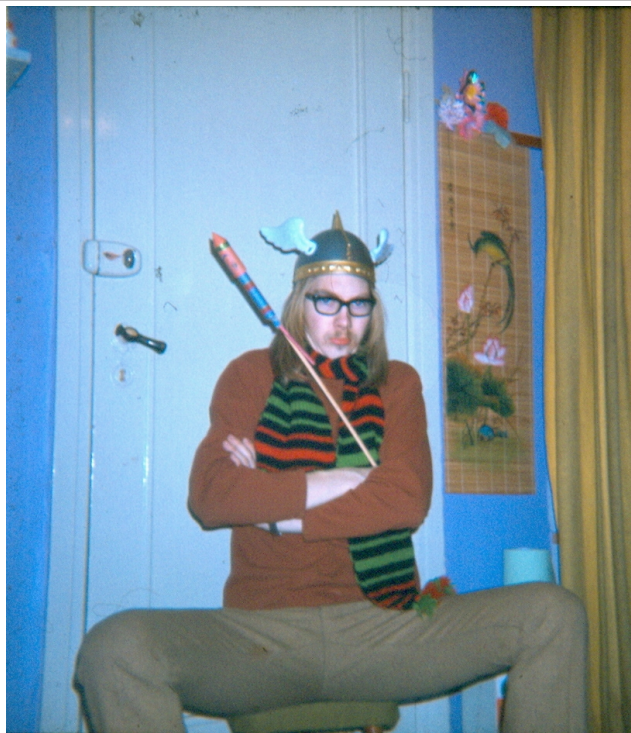
Bag det gule forhæng er vores overtøj