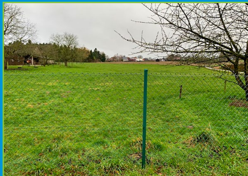
Landbouwperceel tegenover de site gemeentehuis