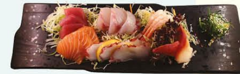
49. Sashimi Mix +€4,00 zalm, tonijn, zeebaars, octopus, zoetwatergarnaal, hokkigai