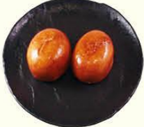
63. Zoet Broodje