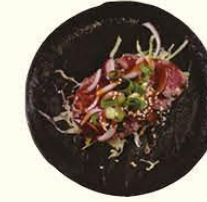
99. Gyu Tatak dun gesneden biefstuk