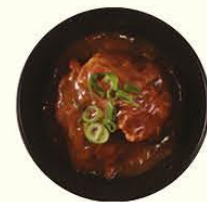
107. Rundvlees Kerrie