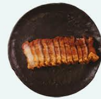
110. Sui Yuk geroosterd speenvarken