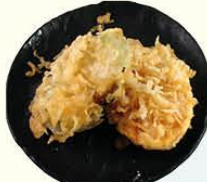
66. Yasai Tempura gefrituurde groenten