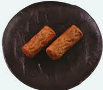
75. Mini Frikandel

vegetarisch bevat gluten bevat eieren bevat melk bevat soja