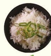
78. Gohan witte rijst