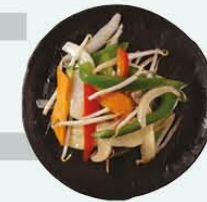
104. Gebakken Groenten