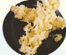
67. Ebi Tempura gefrituurde garnalen