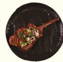
101. Kohitsuji lamsrack