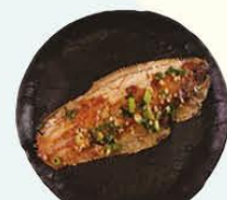
86. Shitabirame gebakken sliptong