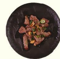
97. Gyuniku Yaki gebakken ossenhaas