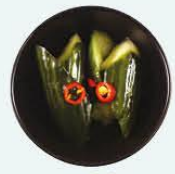
57. Kyuri Tsukemono zure komkommers