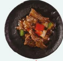
112. Ossenhaas met zwartebonen saus