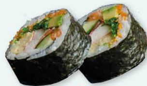
19. Futo Maki Japanse grote rol