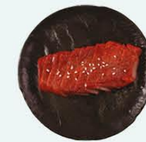
108. Tsa Siew Kantonees geroosterd speenvarken