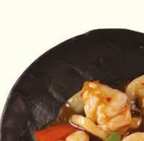
106. Garnalen met knofloksaus