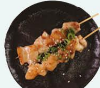
92. Yakitori kipspies