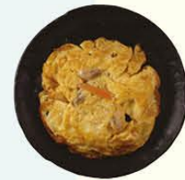
105. Foe Yong Hai vegetarisch omelet