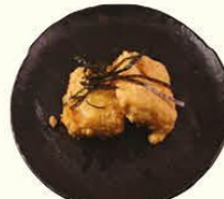
65. Agedashi Tofu