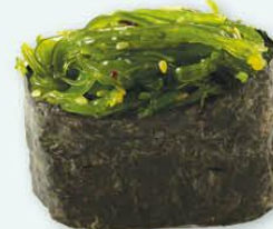
36. Chuka Wakame zeewier