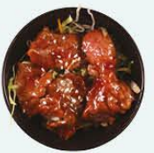
54. Beef Sarada beef salade