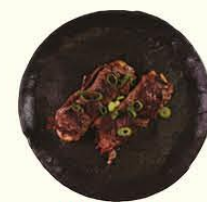
98. Usu Yaki ribeye rolletjes