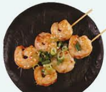
91. Yaki Ebi garnalenspies