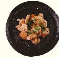
100. Tori Teriyaki kipfilet teriyaki saus