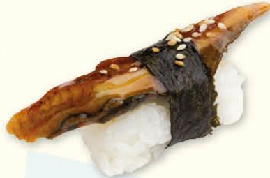
09. Unagi paling