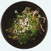
58. Wakame Sarada zeewier salade