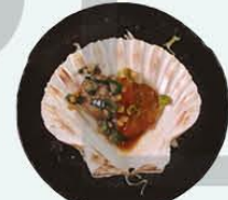
89. Hotategai +€1,00 gegrilde Sint Jacobsschelp