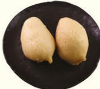
62. Gebakken Banaan