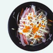
51. Kani Sarada krabstick salade