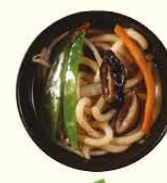
79. Udon Supu veg. udon soep