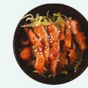
55. Crispy Chicken Sarade krokante kip salade