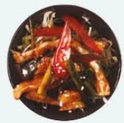
53. Tori Sarada kip salade