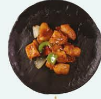
113. Chili Tori kip met Thais chilisaus