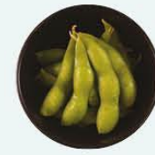
56. Edamame sojabonen