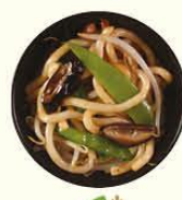
76. Yaki Yasai Udon gebakken udon