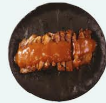
109. Babi Pangang