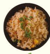
77. Yasai Meshi gebakken rijst