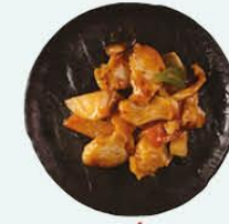
111. Kipfilet met pikante saus