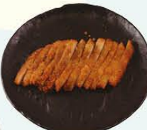
72. Tori Karaage gefrituurde kip