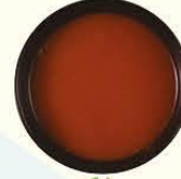
82. Tomaten soep