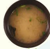
81. Misoshiru sojabonen soep