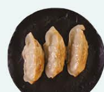
95. Gyoza pasteitjes