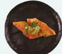
85. Sake Teriyaki gebakken zalm filet