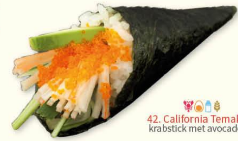
42. California Temaki krabstick met avocado