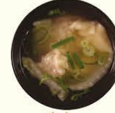
83. Wantan Soep pasteitjes soep