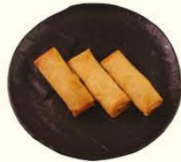
59. Mini Loempia's