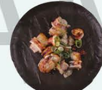
87. Ika gebakken inktvis