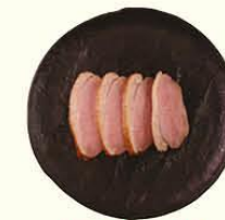
96. Ahirue Yaki eendenborst filet