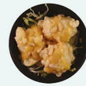
52. Ebi Sarada garnalen salade