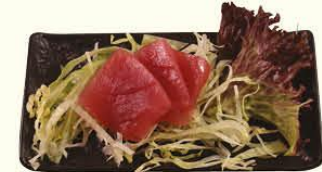
48. Maguro Sashimi +€1,00 tonijn