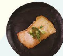
84. Shimisakana gegrilde witvis filet