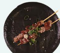
93. Yaki Gyu beefspies