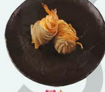
70. Ebi Korokke garnaalkroket