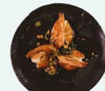
90. Ebi Teppanyaki gegrilde gamba's