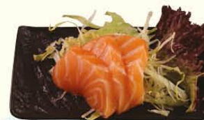
47. Sake Sashimi zalm