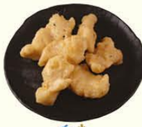
68. Gefrituurde Vis