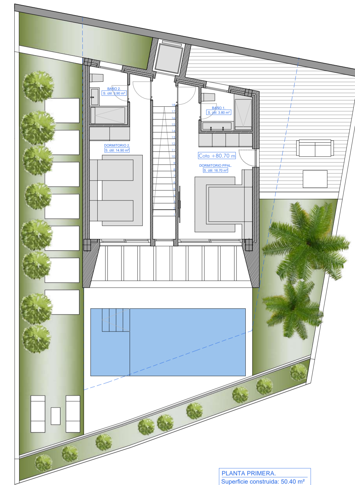
PLANTA PRIMERA Superficie construida: 50.40 m²