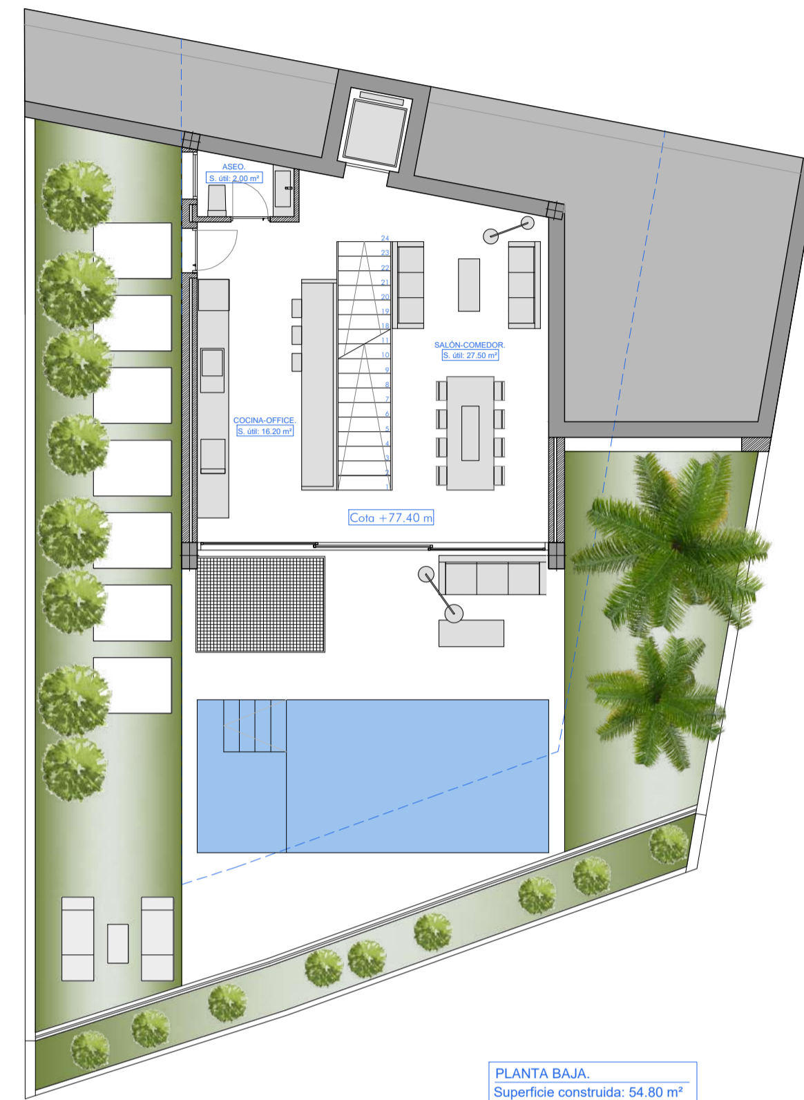
PLANTA BAJA Superficie construida: 54.80 m²