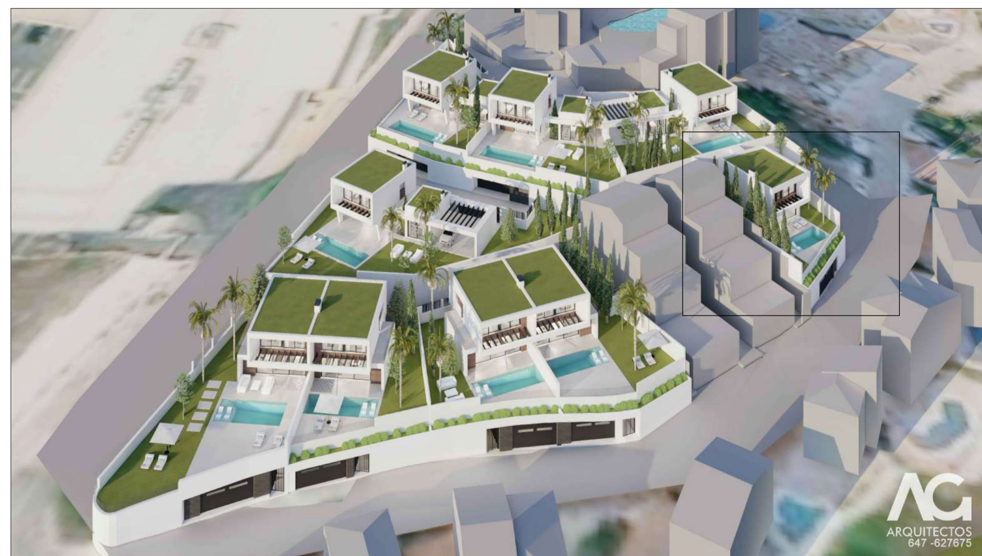
IMAGEN DE CONJUNTO.