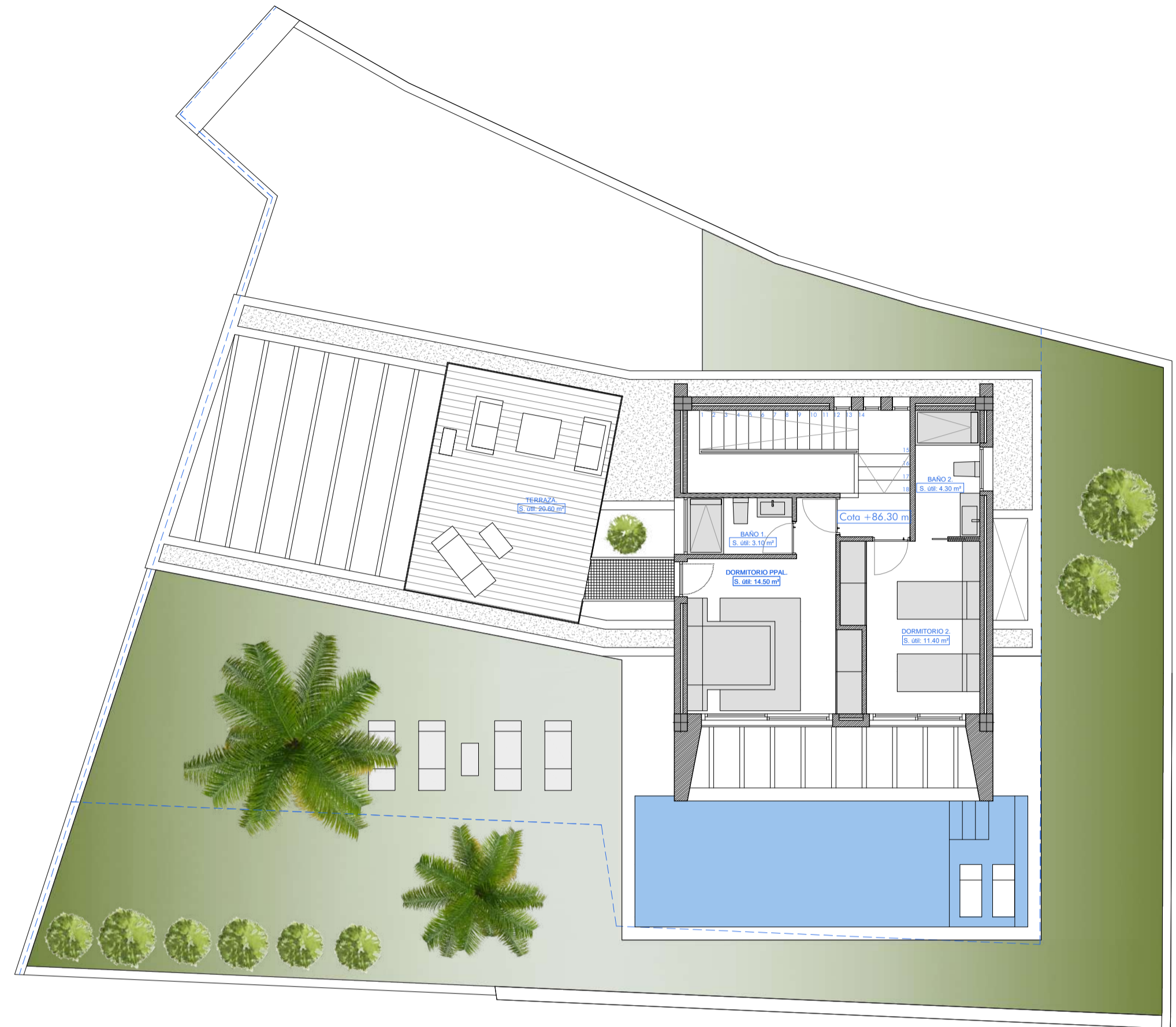
PLANTA PRIMERA: Superficie construida: 43.50 m 2