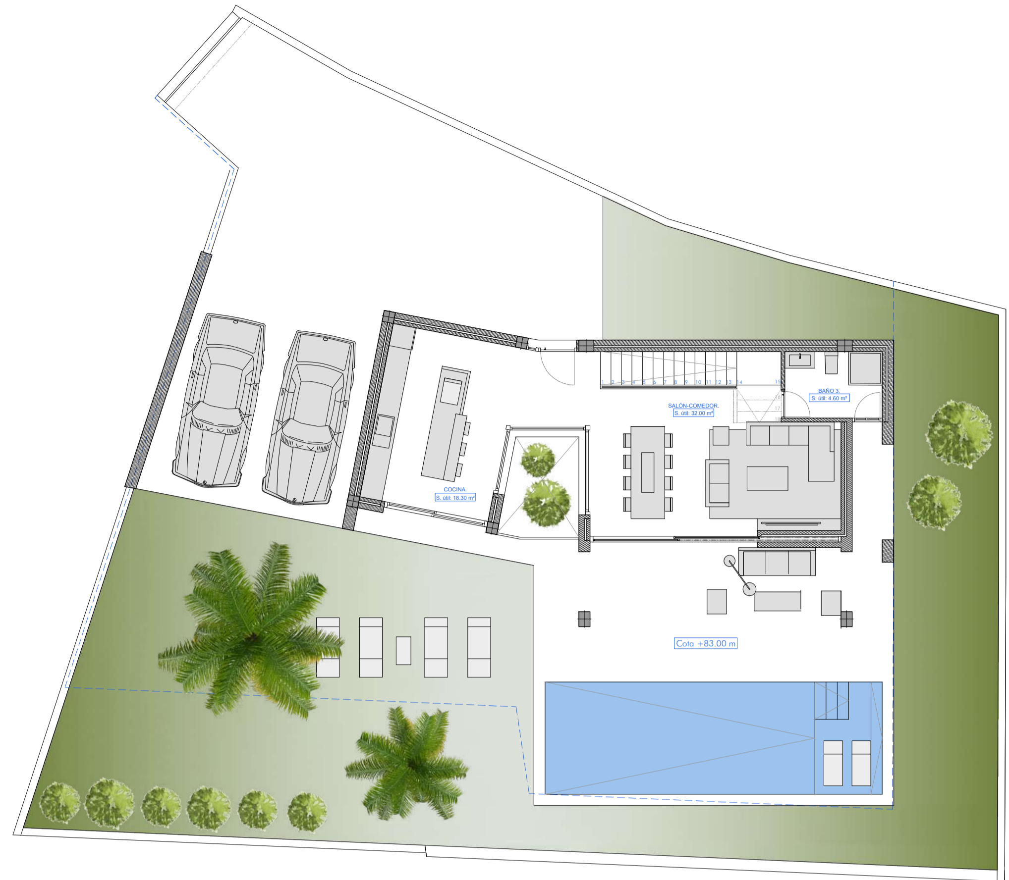
PLANTA BAJA: Superficie construida: 66.10 m 2