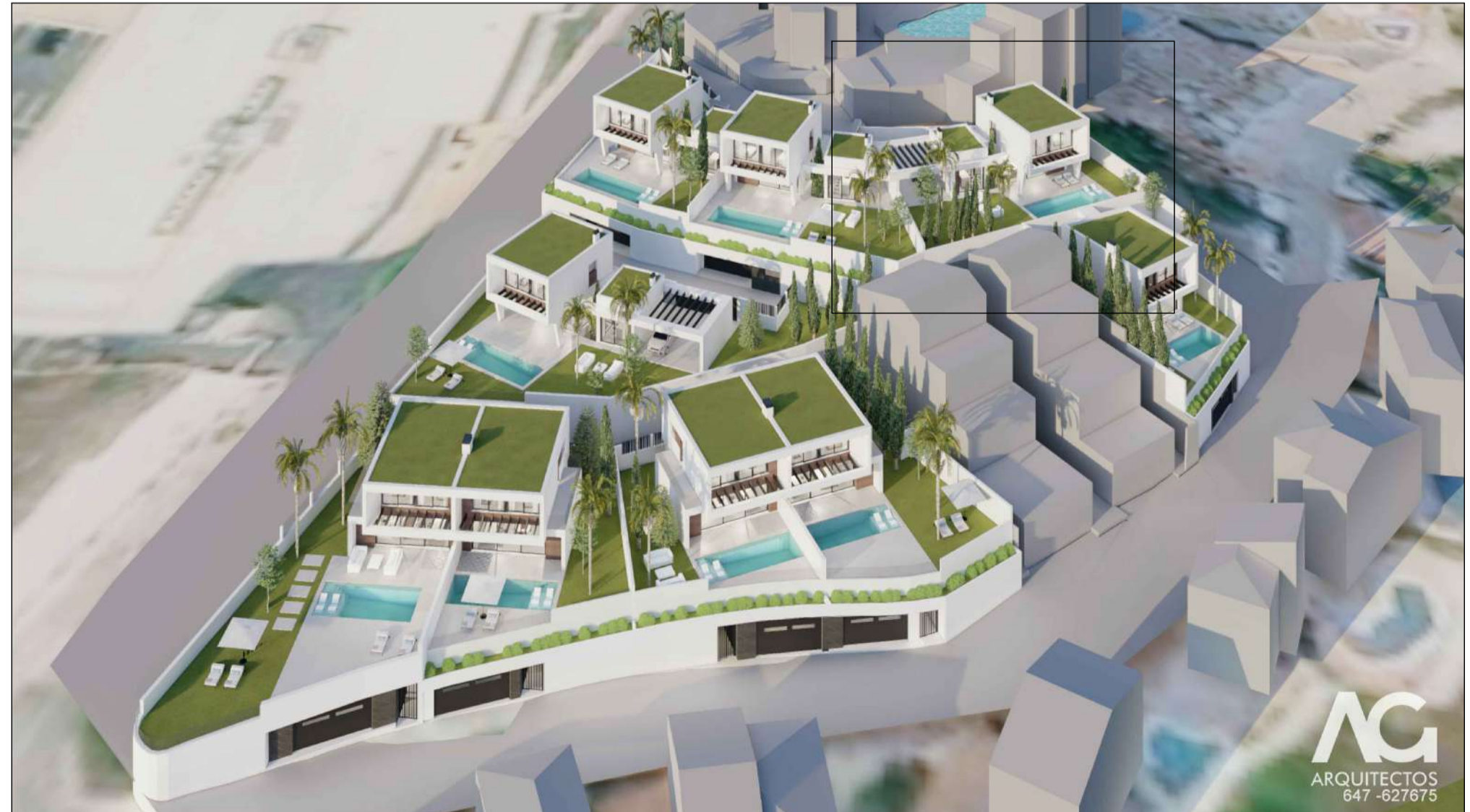
IMAGEN DE CONJUNTO.