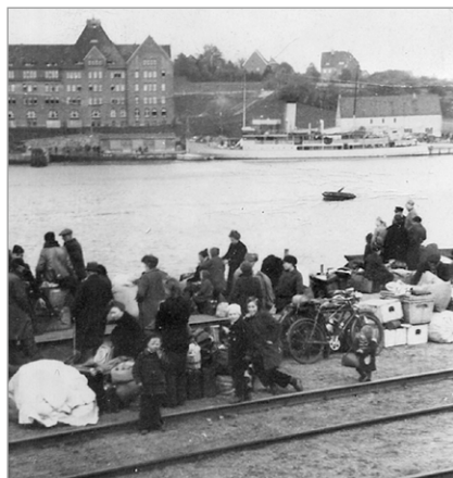
Tyske flygtninge venter ved Sønderborg banegård

Den tyske besættelsesmagt havde pålagt mindretallet at hjælpe til med flygtningene, og på den måde kommer den unge pige i kontakt med en ung mand fra mindretallet, og de gennemlever så et forår og en sommer, hvor de tilbringer så megen tid sammen som muligt.