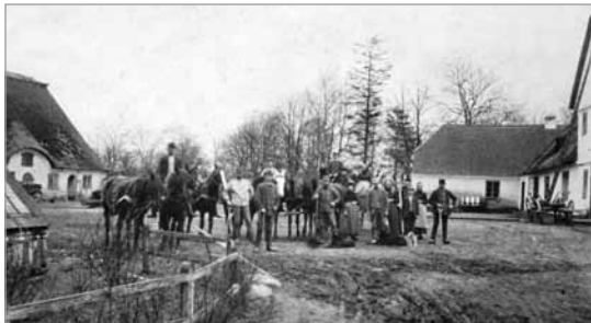
Heste og folk foran præstegården ca. 1910