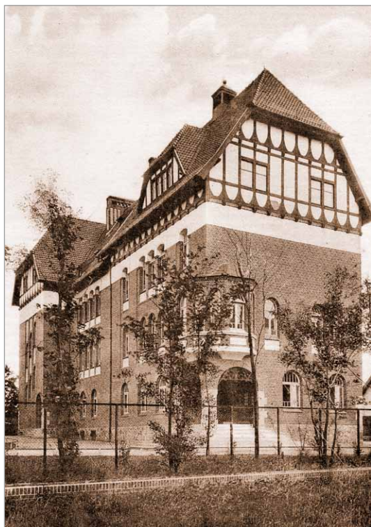
Skolen på Kejser Wilhelms Allé. Skolen fik i 1937 navnet Ahlmann-Skolen i forbindelse med, at endnu en ny skole kom til, Sct. Jørgens Skole

Byen havde mistet ca. 2.500 af sine indbyggere ved nedlæggelsen af marinestationen og en vis fraflytning ved adskillelsen fra Tyskland. Byens befolkning havde lidt nød under krigen og byens ressourcer var stærkt nedslidte. Det gjaldt også byens skoler, der havde været uden varme og uden vedligeholdelse, da krigen havde krævet alle ressourcer. For skolerne var nøden blevet forstærket af, at mange lærere havde været indkaldt under krigen og sammen med sult, kulde og den spanske syge sidst i 1918 havde det ført til meget stort elevfravær og disciplinære vanskeligheder på skolen på Kejser Wilhelms Allé.