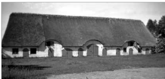
Den fredede lade fra 1855

Det var ikke muligt for synsmændene, at få noget at vide om laden, "da præsten ikke var hjemme for at give de fornødne oplysninger desangående." De øjensynligt sure synsmænd fastslog, "at dette byggeri var menigheden uvedkommende og måtte ske for præstens egen regning." Krog-Meyer søgte imidlertid om, at det måtte