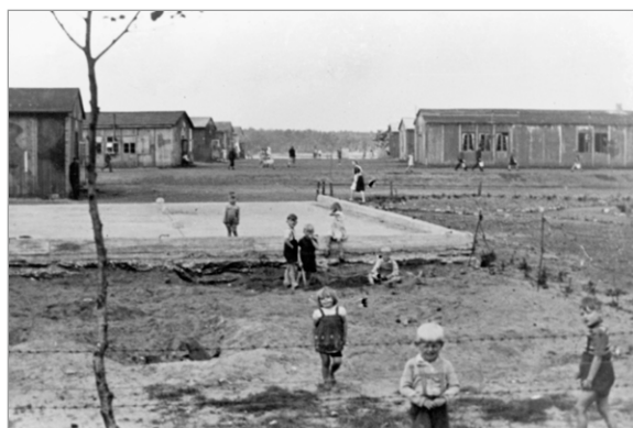
Historiske billeder fra Oksbøl-lejren