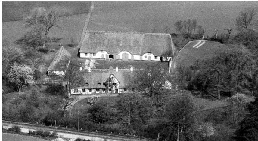
Luftfoto ca. 1950

Efter 1940 var laden i en årrække udlejet til fem af områdets husmænd. Disse havde hver deres afsnit i laden til opmagasinering af kornneg, som de i fællesskab tærskede om vinteren.