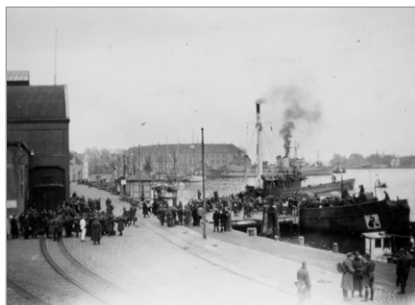
Tyske flygtninge på havnen ved Solo

Der kom flere med tog, men i løbet af marts måned gik togtrafikken i det nordlige Tyskland i stå. Herefter var der kun mulighed for at komme væk med skib og lange strækninger til fods mellem mulig-