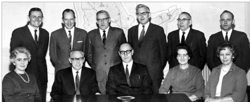
Det sidste sogneråd i den gamle Ulkebøl Kommune