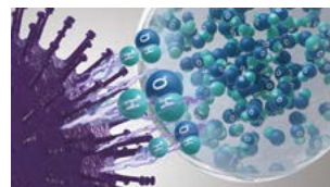
Hydroksylradikaler denaturerer proteinene i forurensende stoffer.