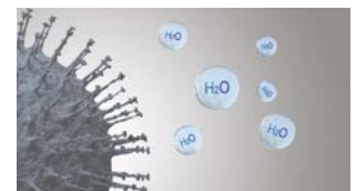
Aktiviteten til forurensende stoffer hemmes.