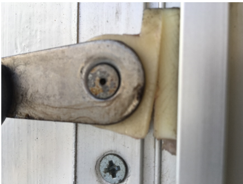
Figur 2: Plastglider med sprekk