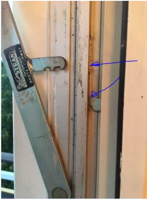
Figur 3: Barnesikrings systemet

Det kan også bli problemer med at barnesikringen blir treg og vanskelig å løse ut.