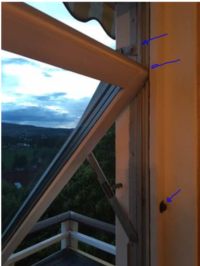
Figur 1: Fjordtre vindu med de forskjellige komponentene

Vinduene som ble brukt ved oppføring av husene våre er av type «Fjordtre», og disse er dessverre nå gått ut av produksjon. Vi har vel alle en 15-16 slike, i litt forskjellig størrelse. Inne i karmen er et aluminiums glidespor der det går to plast glidere; en på en arm (øverst på bildet under), og en i vinduets øvre hjørne. I tillegg er det en nedre arm som er «hengslet» med en flat bolt på karmen og på vinduet. På høyre side er det også en barnesikring som løses ut ved en trykk-knapp.