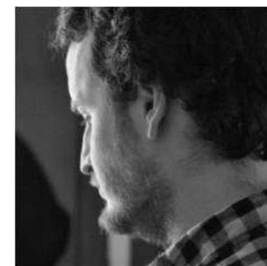
Actor y músico en Pangeia.

Graduado medio CMU Vigo especialidad en gaita gallega. Como músico escénico multinstrumentista puede tocar guitarra , bajo, batería , viento madera , viento metal , percusiones... Trabajó en varias producciones para compañías como Tranhallada, Non sí, o Fondo Galego de Cooperación, Lambriaca Prod, Matreska y Oito milímetros de la que es fundador y en la que dirige y actúa. En 2007 gana el premio como intérprete en el 4º Certamen de Teatro Inmediato en Gondomar. Actualmente combina trabajos en teatro con audiovisual en la TVG.