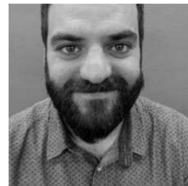
Actor e técnico en Pangeia.