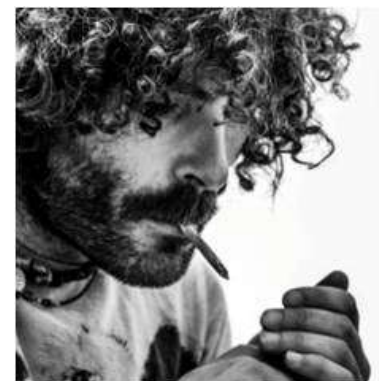
Actor y bailarín en Pangeia.