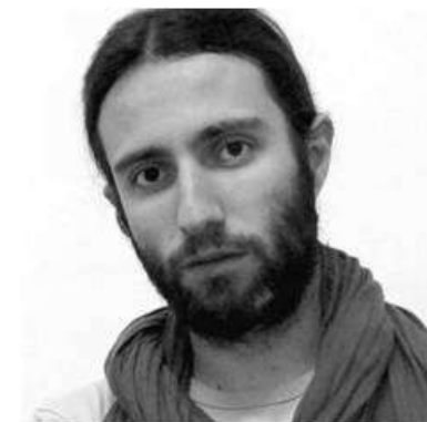
Actor y técnico en Pangeia.