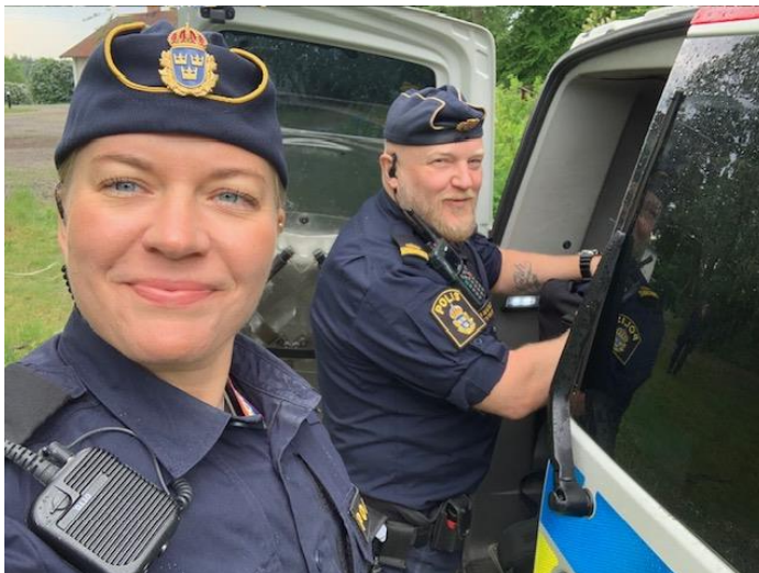
Två glada Kommunpoliser som träffade allmänheten på Bergadagarna i juni.