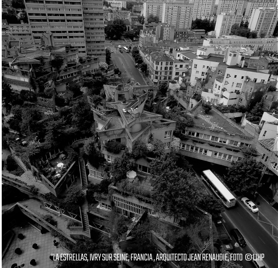
"LA ESTRELLAS, IVRY SUR SEINE, FRANCIA, ARQUITECTO JEAN RENAUDIE

Jean-François, tú expones esta visión, como de capas, ¿no?, donde primero está la infraestructura, pensando cómo se va a resolver el problema de los servicios, luego viene la arquitectura y, finalmente el paisajismo y, de alguna manera, todo esto compone la estructura urbana, ¿no? Entonces, ¿cuáles consideras que, a tenor de este proyecto, son los límites de la imaginación arquitectónica? De imaginar el lugar, ¿cómo se puede dar respuesta para generar espacios ahí donde el tema de la infraestructura no está resuelto?