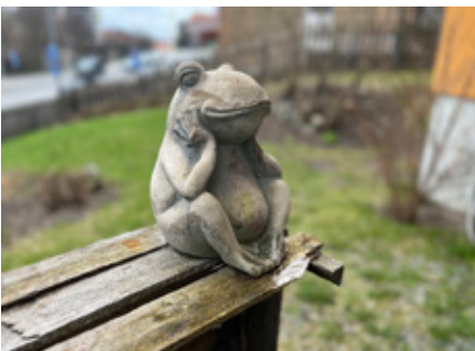
7. Här sitter en glad figur utanför en inrättning, vilken?