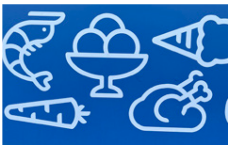
9. Mönster på en vägg. Vad finns innanför väggen?