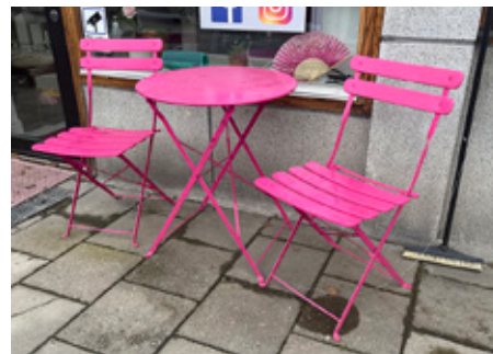
8. Dags att sitta ner och vila igen. Utanför en butik som heter vadå?