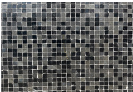
6. Mönster igen. Var sitter det?