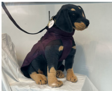
1. Jodå, du kan stöta på hundar på Stockholmsvägen. Men var?

Vi publicerar de rätta svaren den 1 juni. Nästa tävling kommer den 2 juni kl 08.00.