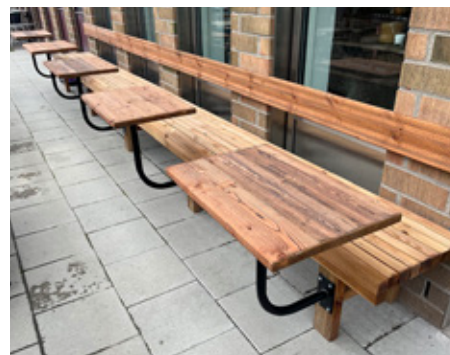
2. Här kan du sätta dig ner en stund och vila. Var är det?