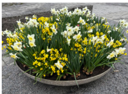
4. Denna bild togs i mitten av april. Förmodligen har dessa blommor vissnat när tävlingen är igång. Nämn ett matställe i närheten (flera alternativ möjliga).