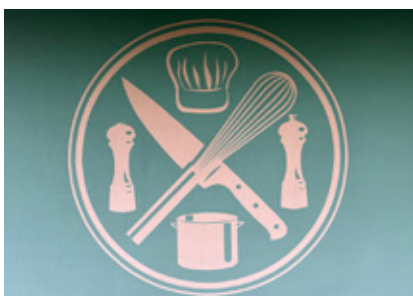
10. Detta är en del av en logotyp till en affär. Vilket nummer på Stockholmsvägen finns den?

Vill du bidra med en bildrebus? Skicka in din/dina bilder (och facit) så kan du vara med och skapa nästa månads rebusjakt: info@lidingonyheter.se Bildrebusjakten är ett samarbete mellan Lidingö Nyheter och Lidingö Hembygdsförening. Konstruktör och fotograf: Andreas Lindberg.