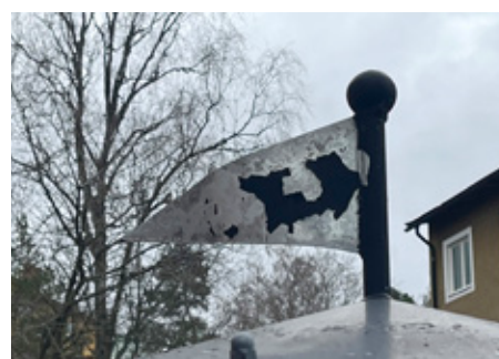
5. Flaggan i topp! Närmaste affär/butik/företag?