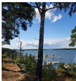
7. Högt och vackert.