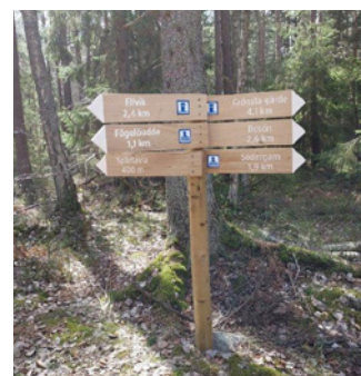
6. En vägvisare.