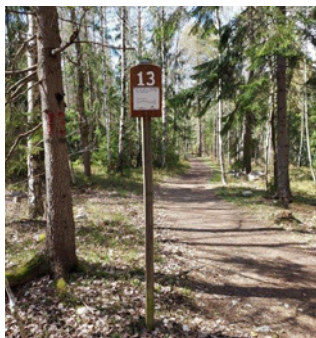
Så här ser km-markeringarna ut.

OBS! Undvik spåret under perioden 24-26 september, eftersom det då är Lidingöloppshelg.