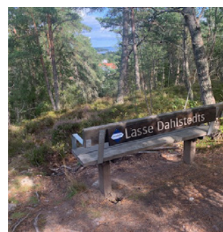
2. Strålande utsikt!