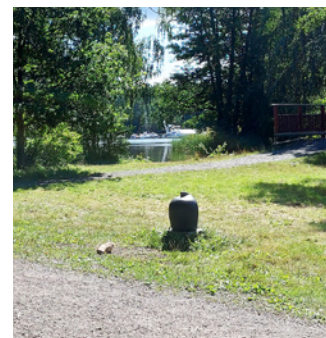
4. Lätt att löpning blir vandring här.