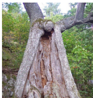
8. Sagofigur (25 m från spåret)