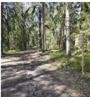
5. Viktig vändpunkt.