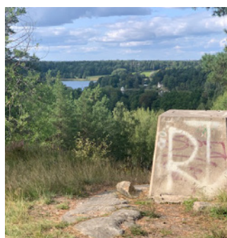
3. Också en strålande utsikt!