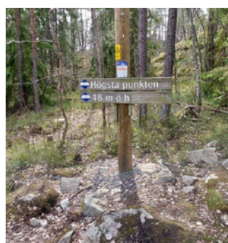
11. Nu kan det bara gå utför.