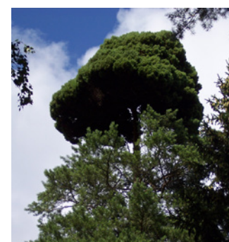
10. Häxväxt – se upp i backen!