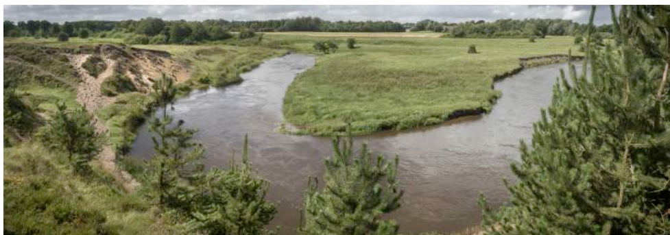
Skjern Å ved Clasonsborg

Den hyggelige Lauth-hytte ved Råsted Lilleå kan benyttes gratis af foreningens medlemmer