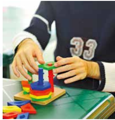
NR. 3 SEPTEMBER 2020 32. ÅRGANG