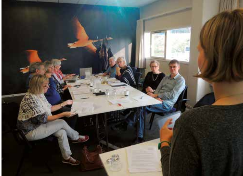
Bestyrelsen for LEV København på konference