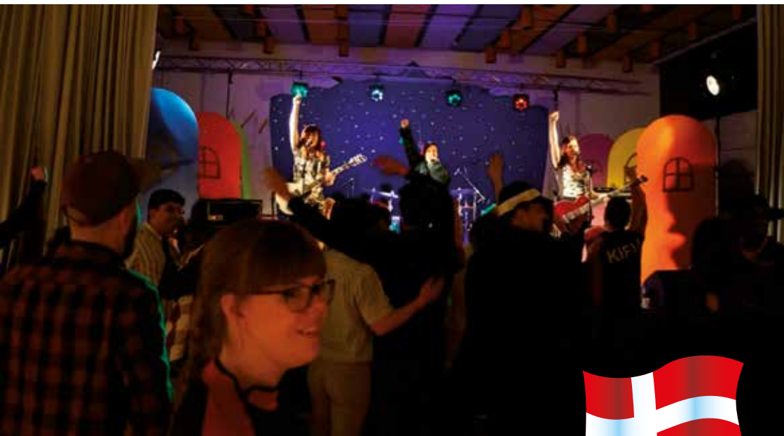
Indtryk fra fødselsdagsfesten