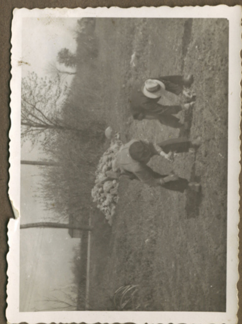
Der plantes kål i engen ved broen