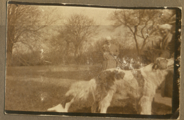
Falle ca 1928 Falle = Fallegård i udkanten af Kværndrup, er revet ned