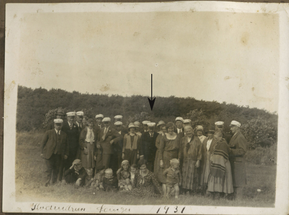
Glædelig hilsen fra sangkor 1931