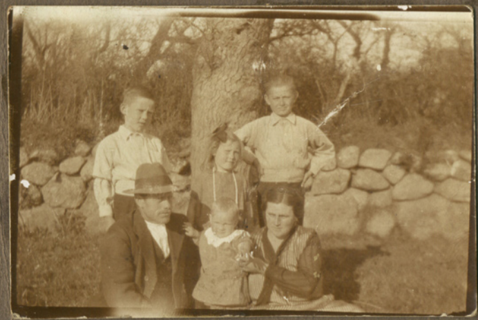
1927 på Fallegård