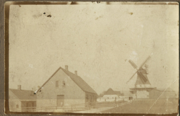
Huset ved 1927 Fallegård