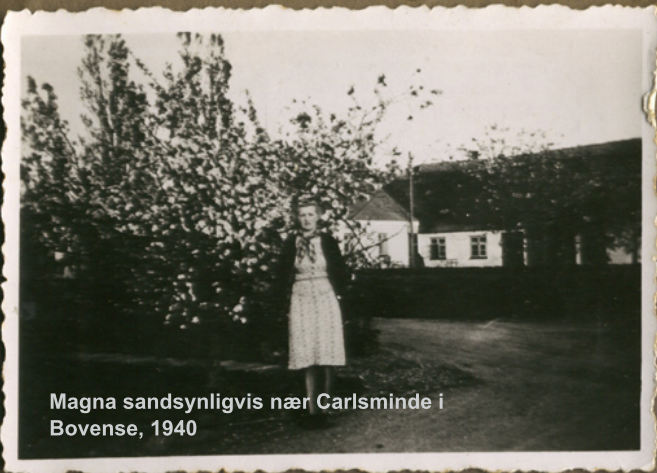
Magna sandsynligvis nær Carlsminde i Bovense, 1940