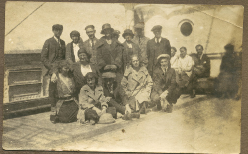
Rejseselskab 1923 (på hjemturen fra Nebraska)