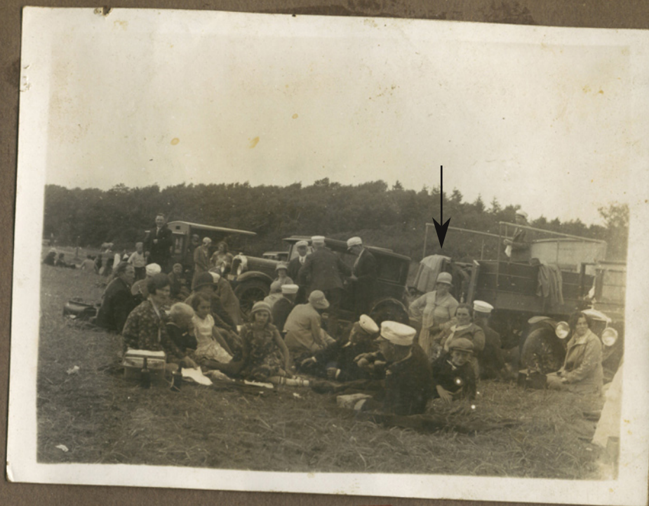
1931 i Faldsled.