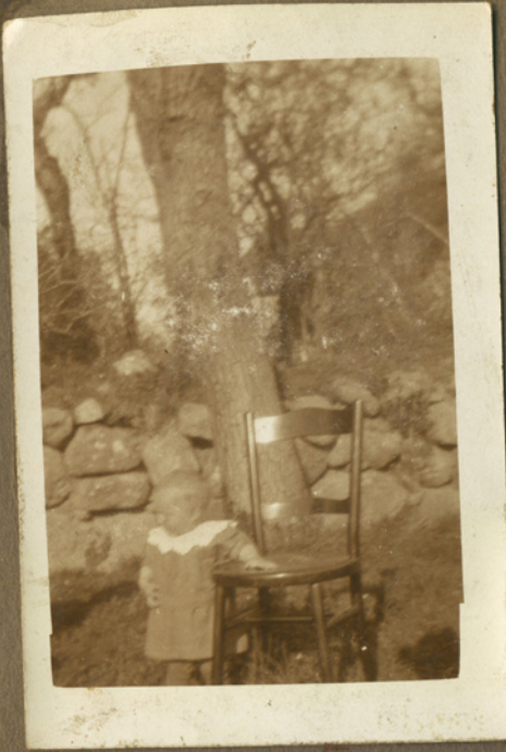
1927 Verner på Fallegård