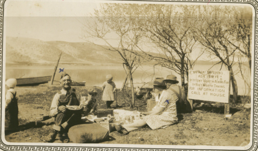
Min mand og mig