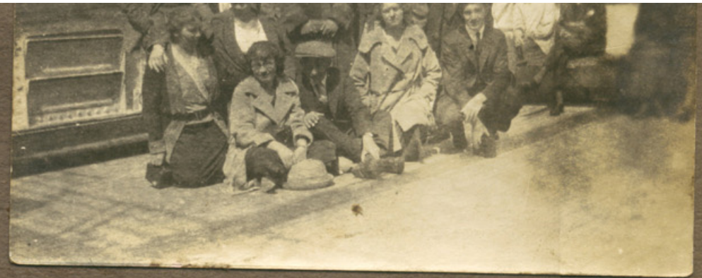
Rejseselskab 1923 (på hjemturen fra Nebraska)