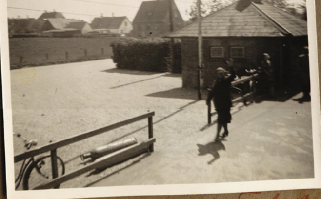
Helmut rejser til Finland