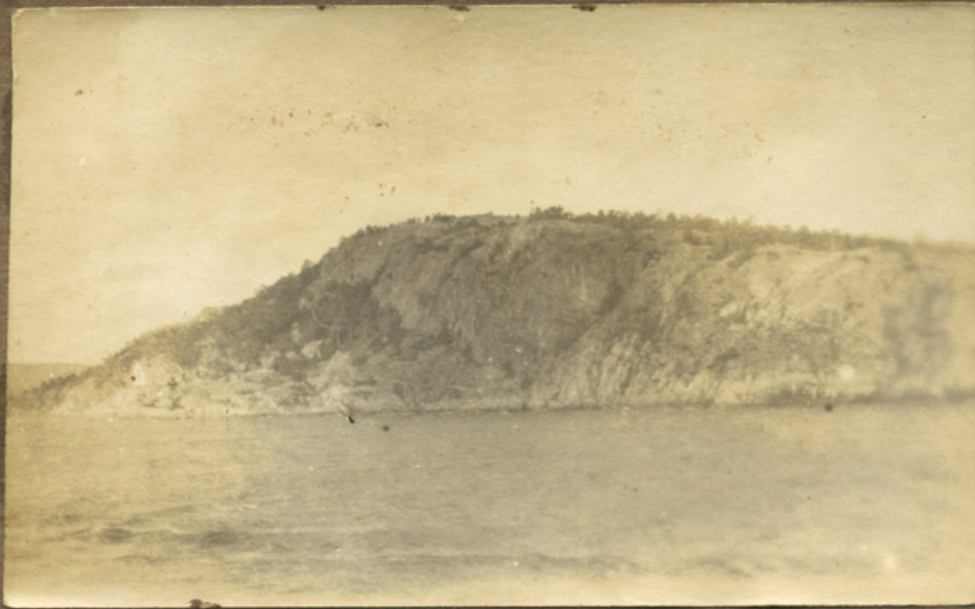
3 partier fra Oslo Fjord