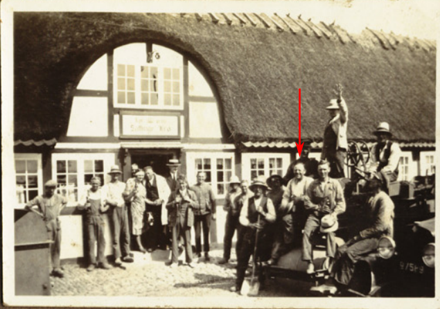
Sallinge Kro, Vejarbejdere