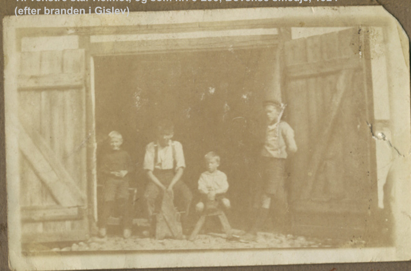
1924 i Bovense Smedie