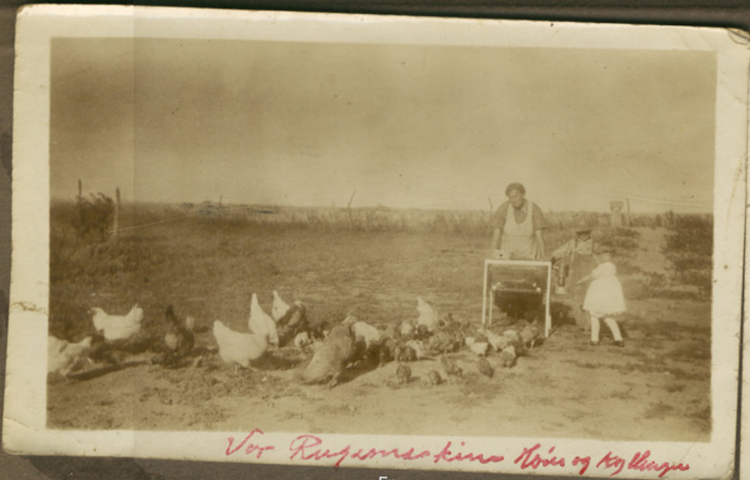
Vor Rugemaskine, høns og kyllinger