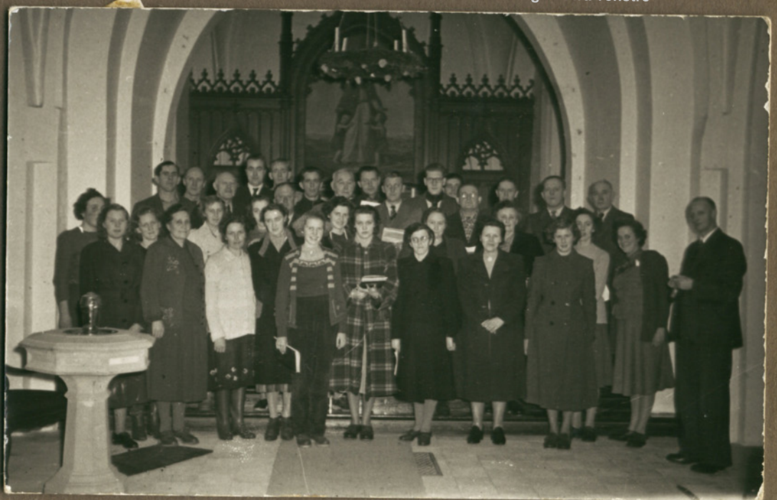
Korsang Juleaften i Kirken