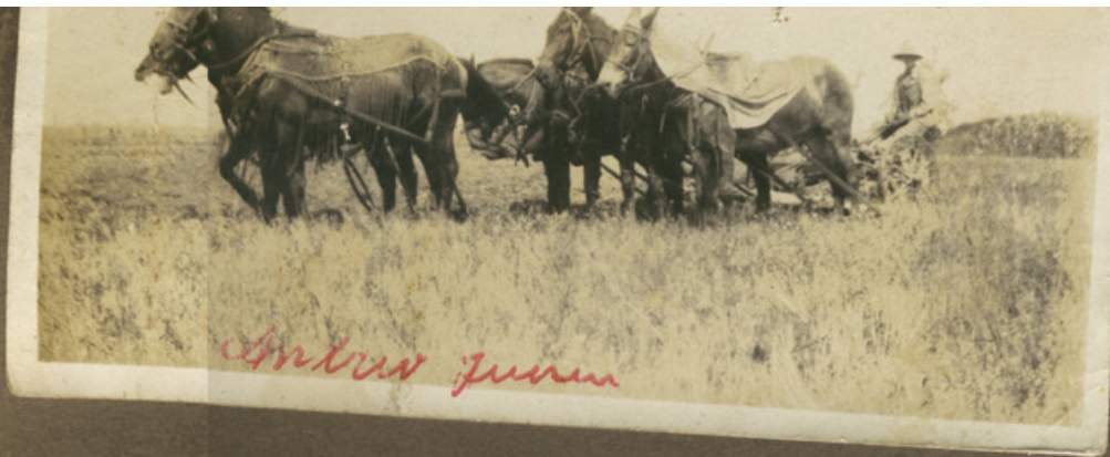
Arbejde i marken