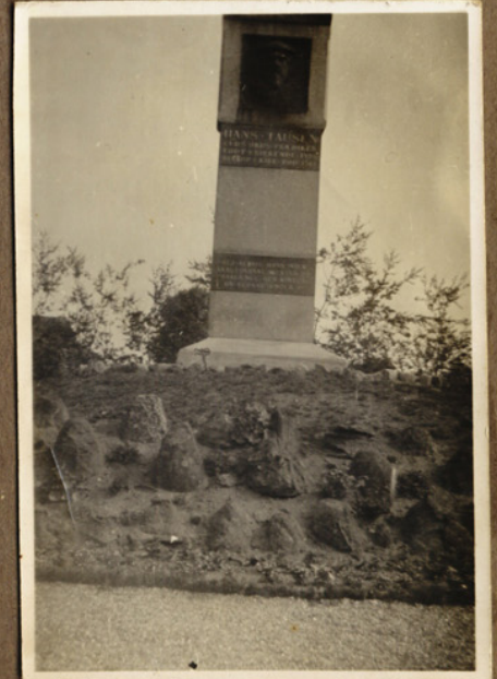
Mindesmærke for Hans Tausen fra Birkende