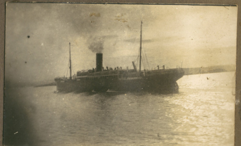
Hellig Olav Udvandrerskibet "Hellig Olav"