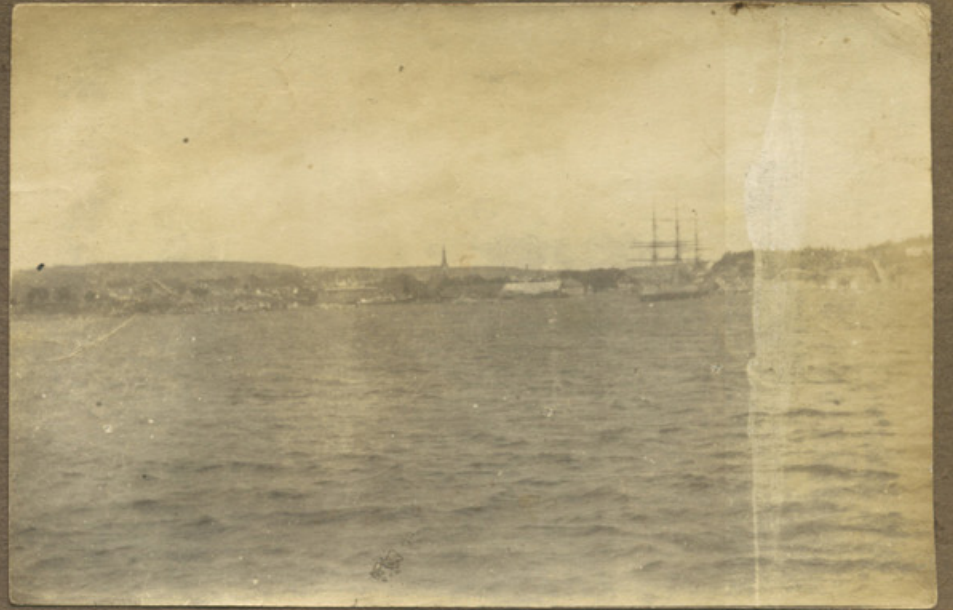
3 Partier fra Oslo Fjord