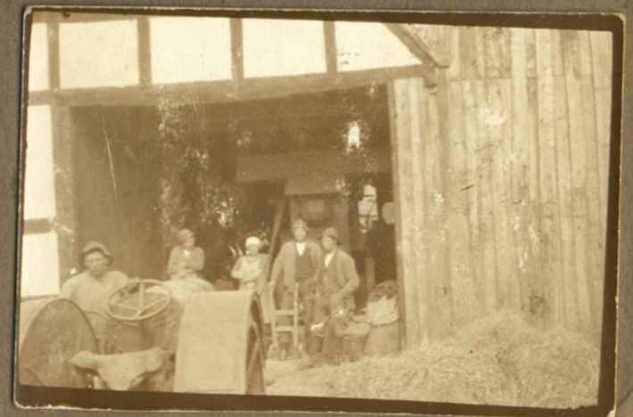
Tærskning på Falle, måske Emma med hvidt tørklæde, 1928