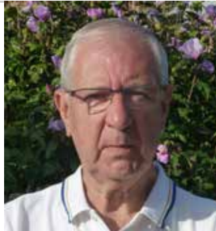
door Leo De Nijn

Als reporter ben ik voor de krant de afgelopen maanden bij veel bewoners langs geweest. Ik heb nauwelijks