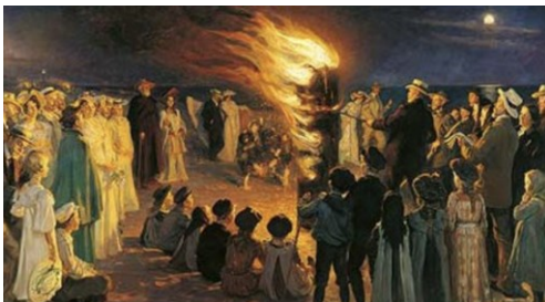
Maleri af P. S. Krøyer i 1906 : "Sankt Hansblus på Skagen Strand"