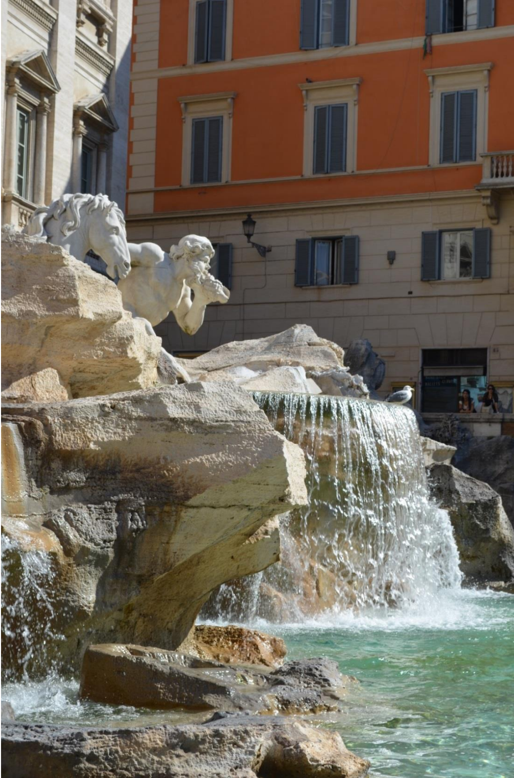
Fontana di Trevi i Rom